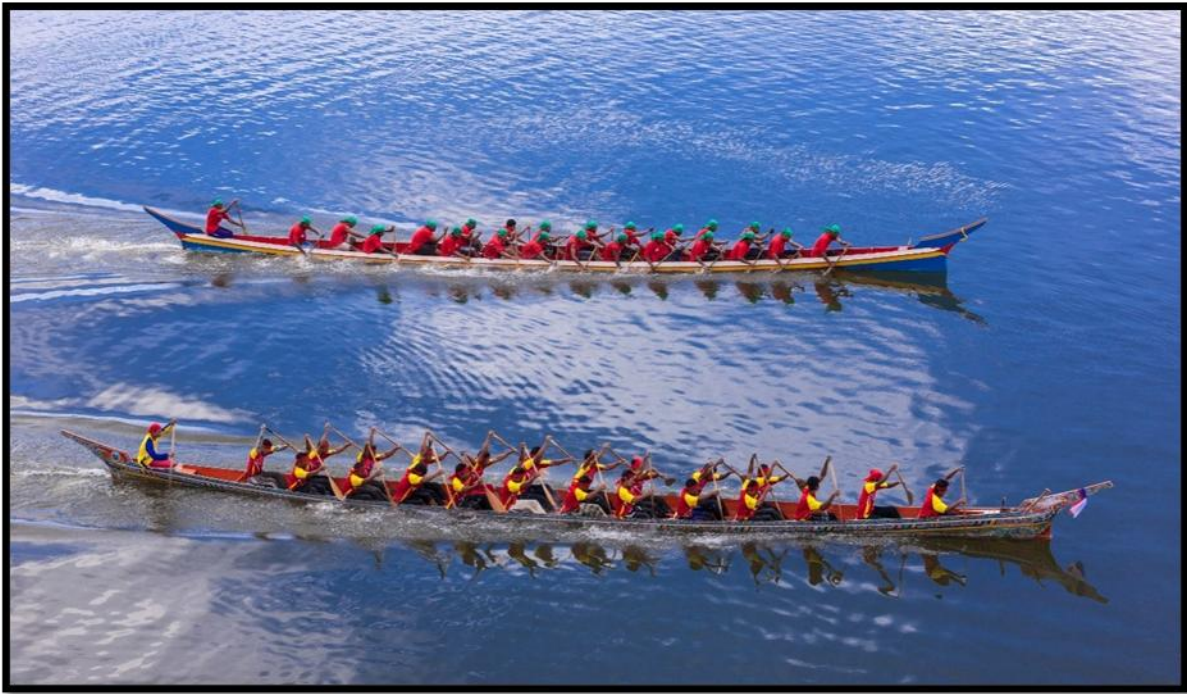
ภาพที่ 2 การจัดการแข่งขันเรือกอลและ เรือยอกอง และเรือคชสีห์

จนกระทั่งในปี 2562 ได้จัดการแข่งขันเรือกอลและ เรือยอกอง และเรือคชสีห์ซึ่งถ้วยพระราชทานหน้าพระที่นั่ง ประจำปี 2562 โดยในปีนี้มีทีมเรือที่สมัครเข้าแข่งขันทั้งสิ้น 52 ทีม ทีมเรือกอลและเข้าร่วมแข่งขัน 18 ทีม ทีมเรือยอกองเข้าร่วมแข่งขัน 16 ทีม และทีมเรือคชสีห์เข้าร่วมแข่งขัน 18 ทีม โดยบรรยากาศในการชมการแข่งขันเรือกอลและ เรือยอกอง และเรือคชสีห์ซึ่งถ้วยพระราชทาน ประจำปี 2562 ในรอบนี้มีประชาชนจากอำเภอต่าง ๆ เดินทางมาร่วมชมเป็นกำลังให้แก่วิ่งที่ตนเองชื่นชอบ และเชียร์ฝีพายเป็นจำนวนมาก รวมทั้งผู้เข้าร่วมการแข่งขันประมาณ 1,475 คน อีกทั้งถือเป็นการร่วมสืบสานประเพณีการแข่งขันเรือของประชาชนในพื้นที่ที่มีมาอย่างยาวนาน งบประมาณในการจัดการแข่งขันในการกระตุ้นเศรษฐกิจในงาน 2,24,875.00 บาท และเป็นการส่งเสริมการสร้างรายได้จากชุมชนในงาน โดยมีการเปิดร้านอาหาร การขายของที่ระลึกต่าง ๆ