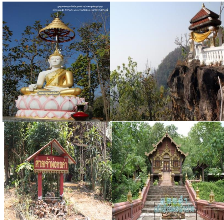
ภาพที่ 2 แหล่งท่องเที่ยวเชิงวัฒนธรรม

ศาลเจ้าพ่อหอคำ ศาลที่เป็นศูนย์รวมจิตใจของคนบ้านสบลิ้น ทุกปีในช่วงเดือน 7 แรม 13 ค่ำ จะมีการประกอบพิธีบวงสรวงด้วยหมูที่เลี้ยง 3 ปี และไก่ที่เลี้ยง 3 ปี และในตอนเย็นบวงสรวงด้วยข้าว และน้ำอ้อย