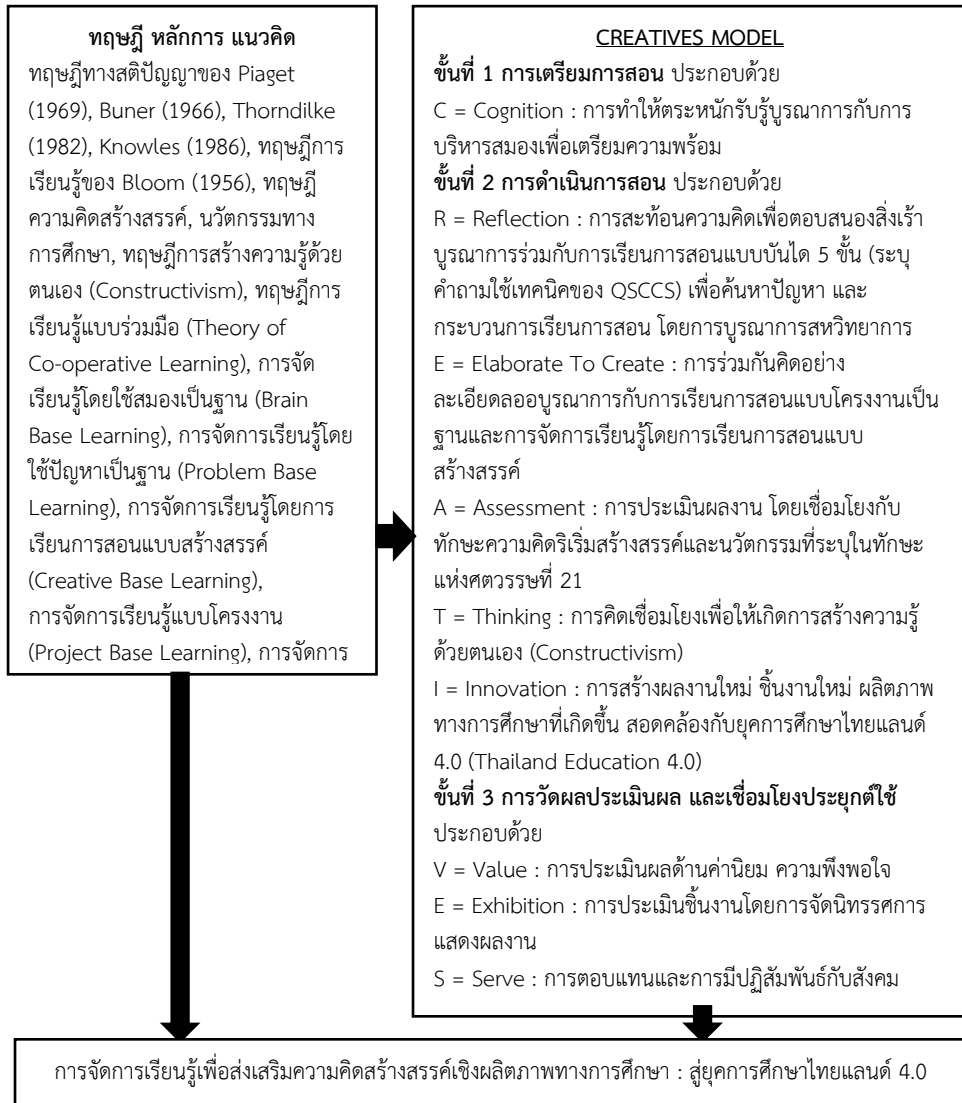
แผนภาพที่ 2 การจัดการเรียนรู้เพื่อส่งเสริมความคิดสร้างสรรค์เชิงผลิตภาพทางการศึกษา : สู่ยุคการศึกษาไทยแลนด์ 4.0