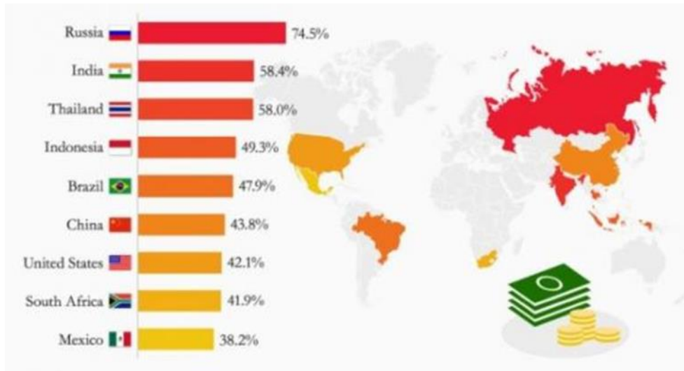
ภาพที่ 1. The world's most unequal countries.