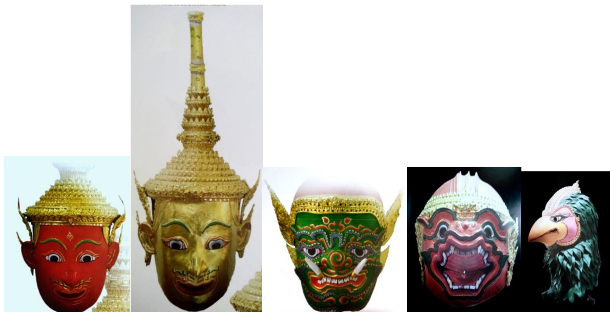
ภาพที่ 1 หัวโขนประเภทต่างๆ