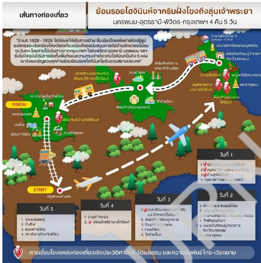
ภาพที่ 3 เส้นทางท่องเที่ยวที่ 2 ย้อนรอยโฮจิมินห์จากริมฝั่งโขงถึงลุ่มเจ้าพระยานครพนม-อุดรธานี-พิจิตร-กรุงเทพฯ