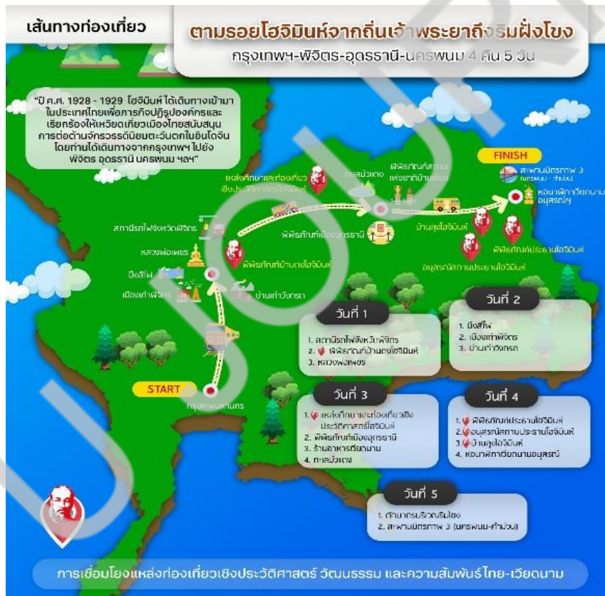
ภาพที่ 2 เส้นทางท่องเที่ยวที่ 1 ตามรอยโฮจิมินห์จากถิ่นเจ้าพระยาถึงริมฝั่งโขงกรุงเทพฯ-พิจิตร-อุดรธานี-นครพนม

2. การสร้างเส้นทางท่องเที่ยวเชิงประวัติศาสตร์ ความทรงจำ วัฒนธรรม และความสัมพันธ์ไทย-เวียดนามในพื้นที่จังหวัดพิจิตร อุดรธานี และนครพนม จากการประชุมเชิงปฏิบัติการแบบมีส่วนร่วม และการสัมภาษณ์ผู้ให้ข้อมูลหลัก ผู้วิจัยได้สรุปประเด็นข้อเสนอเพื่อสร้างเส้นทางท่องเที่ยวภายใต้คำขวัญที่ได้รับการคัดเลือกว่า 1) เส้นทางตามรอยโฮจิมินห์จากกลุ่มน้ำน่านถึงริมฝั่งโขง (4 คืน 5 วัน) 2) เส้นทางย้อนรอยประวัติศาสตร์โฮจิมินห์ในเมืองไทย 3) เส้นทางประวัติศาสตร์โฮจิมินห์ในอีสาน จากนั้นได้ใช้แนวคิดเส้นทางท่องเที่ยวตามทฤษฎี 5As ได้แก่ 1. สิ่งดึงดูดใจ (Attraction) 2. สิ่งอำนวยความสะดวก 3. การเข้าถึงแหล่งท่องเที่ยว (Accessibility) 4. กิจกรรมการท่องเที่ยว (Activities) 5. ด้านการบริหารจัดการนักท่องเที่ยว (Ancillary Service) นอกจากนี้ได้รับการสนับสนุนจากรัฐบาลได้และเวียดนามอีกด้วย ดังภาพที่ 2-4