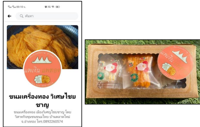
ภาพที่ 2 ตลาดออนไลน์และผลิตภัณฑ์จากฐานทุนทางวัฒนธรรมและภูมิปัญญาชุมชนตลาดใหม่