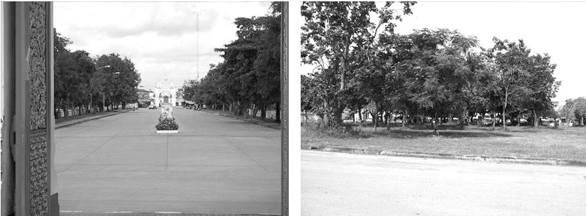
ภาพถ่ายพื้นที่โล่งบริเวณหน้าวัดพระธาตุพนม

รองรับกิจกรรมของเมืองที่เกี่ยวข้องกับประเพณี วัฒนธรรมและศาสนาด้วย เพื่อให้เกิดการใช้พื้นที่ที่คุ้มค่าและกิจกรรมที่เกิดขึ้นจะไม่รบกวนกิจกรรมภายในวัดพระธาตุพนม ส่วนพื้นที่ต่อเนื่องบริเวณหน้าตลาดสดเทศบาล ควรจัดพื้นที่เพื่อให้รองรับกิจกรรมในการท่องเที่ยวโดยเฉพาะที่เกี่ยวกับวัดพระธาตุพนม ซึ่งนำเอากิจกรรมด้านการค้าและที่จอดรถภายในวัดพระธาตุพนมมารวมไว้ในพื้นที่นี้ เพื่อไม่ให้รบกวนกิจกรรมภายในวัด