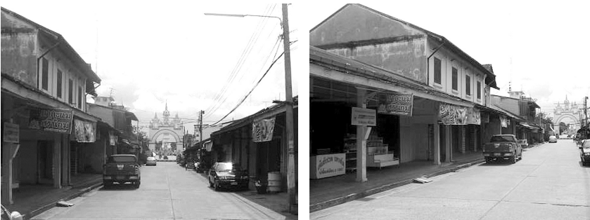
ภาพถ่ายบริเวณพื้นที่ตลาดเก่า (ตลาดลาว)

แนวทางการปรับปรุงและฟื้นฟูกิจกรรมทางด้านการค้าที่ซบเซาของพื้นที่บริเวณนี้ อาจกระทำได้โดยการปรับกิจกรรมการใช้อาคาร (Adaptive Re-use) เพื่อใช้ประโยชน์ในรูปแบบอื่น รวมทั้งการปรับปรุงอาคารในเชิงอนุรักษ์ เพื่อรักษารูปแบบทางสถาปัตยกรรมเดิมของพื้นที่ โดยพื้นที่ส่วนนี้จะต้องเชื่อมต่อทางกิจกรรมและส่งเสริมมุมมองที่ดีต่อวัดพระธาตุพนมด้วย