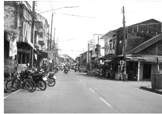
ภาพถ่ายแสดงรูปแบบทางสถาปัตยกรรมชุมชนริมถนนพนมพนารักษ์