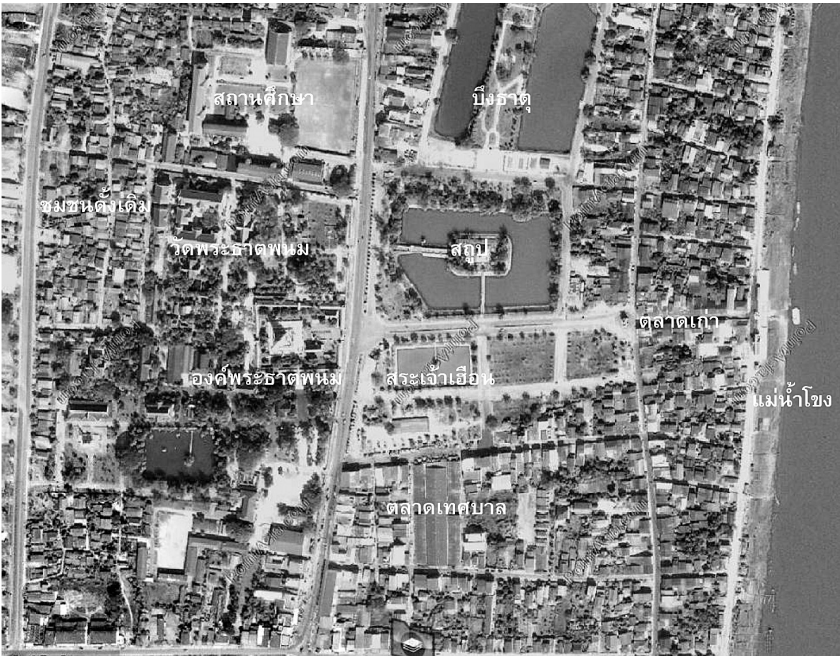
ภาพถ่ายทางอากาศบริเวณวัดพระธาตุพนมและพื้นที่โดยรอบ