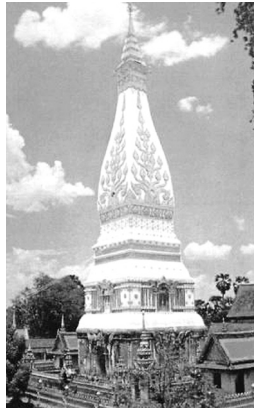
พระธาตุพนม หลังการบูรณะโดยกรมศิลปากร พ.ศ. 2483-2484