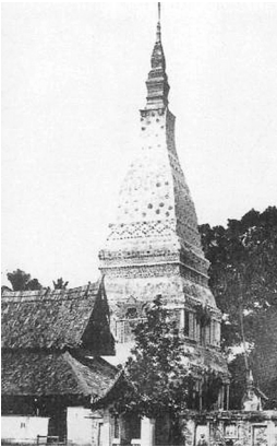
พระธาตุพนมองค์เดิม ก่อนการบูรณะโดยกรมศิลปากร