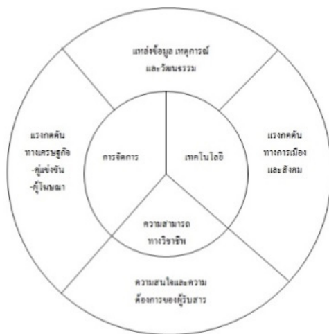
ภาพที่ 1 ปัจจัยที่ส่งผลต่อการผลิตงานขององค์กรนักข่าว

1) ปัจจัยภายใน หมายถึง ปัจจัยที่เกิดขึ้น ภายในตัวองค์กรนักข่าว ประกอบไปด้วย การจัดการ (management) ที่เกี่ยวข้องกับการบริหารงาน และนโยบายการผลิตงานขององค์กรนักข่าว รวมถึงการจัดการทรัพยากรต่าง ๆ ให้เกิดประโยชน์สูงสุด เทคโนโลยี (technology) ปัจจัยที่มีความเกี่ยวข้องกับการผลิต และการประสานงานเพื่อรองรับรูปแบบการทำงานให้รวดเร็วและมีประสิทธิภาพ และสุดท้ายความสามารถทางวิชาชีพ (media professional) ที่นักข่าวนำมาใช้ในการรายงานข่าวสถานการณ์ ทั้งความคิดพื้นฐานด้านความรู้ ความคิดสร้างสรรค์และประสบการณ์ของการทำงานในแต่ละฝ่าย ที่จะทำให้งานที่ผลิตมีความน่าสนใจมากขึ้น และมีประสิทธิภาพมากที่สุดด้วย