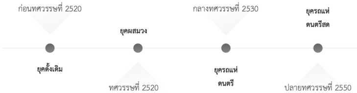
ภาพที่ 1 พัฒนาการของรถแห่ดนตรีสด

อาจกล่าวได้ว่ารถแห่ดนตรีสดมีพัฒนาการอย่างต่อเนื่อง เริ่มจากเครื่องดนตรีไม้ที่ ขึ้นที่นำมาใช้บรรเลง เช่น พิณ แคน กลองยาว มาเป็นเครื่องประกอบจังหวะที่ใช้เล่น หรือแสดง ประกอบพิธีกรรม นำมาสู่การผสมวงที่มีทั้งเครื่องดนตรีพื้นบ้านและเครื่องดนตรีสากลเข้ากัน และ เชื่อมต่อเครื่องขยายเสียงบนรถบรรทุก จนกลายมาเป็นรถแห่ดนตรีสดที่สามารถบรรเลงดนตรีบน ตัวรถ และเคลื่อนที่ไปทำการแสดงไปตามสถานที่ต่าง ๆ ของชุมชนได้ โดยผู้วิจัยได้สรุปที่มาและ พัฒนาการของรถแห่ดนตรีสดไว้ในภาพที่ 1