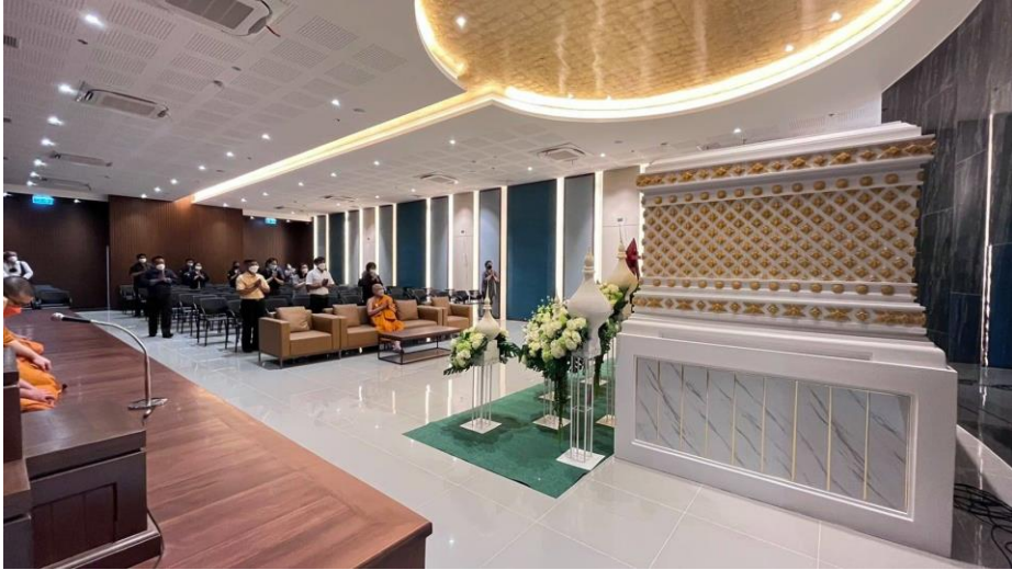
ภาพที่ 1 สุคติสถาน วัดชลประทานรังสฤษดิ์ พระอารามหลวง นนทบุรี