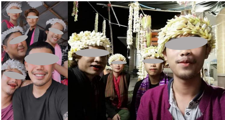
ภาพที่ 1 การแต่งกายของมะมีวดผู้มีความหลากหลายทางเพศ