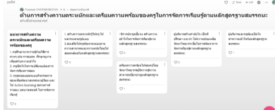
ภาพที่ 2 ข้อเสนอแนะของผู้ให้ข้อมูลสำคัญผ่านโปรแกรม Padlet

จากการวิเคราะห์ทางเลือกเพื่อพัฒนาแนวทางการเตรียมความพร้อมของครูฯ ด้วยเทคนิคกลุ่มสมมติดังภาพที่ 2 พบว่าแนวทางด้านการสร้างความตระหนักและเตรียมความพร้อมของครูในการจัดการเรียนรู้ตามหลักสูตรฐานสมรรถนะซึ่งมีลำดับความต้องการจำเป็นสูงสุดและมีสาเหตุสำคัญมาจากทั้งครูและบริหารสถานศึกษาที่ผู้ให้ข้อมูลสำคัญเห็นว่าสำคัญและเร่งด่วนมากที่สุด (ผลลงคะแนนความถี่เท่ากับ 8) ได้แก่ ครูควรเปิดใจกับการเปลี่ยนแปลง ศึกษาหาความรู้ด้วยวิธีการต่าง ๆ เช่น การอบรม ศึกษาดูงาน เพื่อสร้างความเข้าใจในหลักสูตรฐานสมรรถนะ และควรทดลองออกแบบกิจกรรมการเรียนรู้ โดยการใช้ Active Learning สถานการณ์จำลอง บทบาทสมมติ เพื่อพัฒนาสมรรถนะของนักเรียน