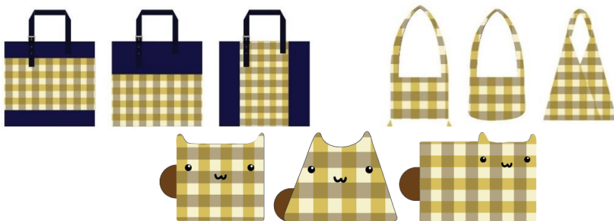
ภาพที่ 3 ภาพร่างแนวคิดการออกแบบกระเป๋าตุ๊กตาผ้าขามมาเนนวทาย

และตัวแทนกลุ่มทอผ้าบ้านชลประทาน ตำบลหันห้วยทราย อำเภอบัวลาย จำนวน 20 คน ต้องการผลิตภัณฑ์ประเภทกระเป๋าสะพายข้าง กระเป๋าย่อม กระเป๋าเก็บผ้าคลุมไหล่ กระเป๋าใส่ผ้าพันคอ ซึ่งผลิตภัณฑ์ที่กลุ่มต้องการนั้นที่ไม่เกินศักยภาพด้านการผลิตของกลุ่มเนื่องจากสมาชิกกลุ่มบางคนมีพื้นฐานด้านตัดเย็บมาก่อน รวมถึงผลิตภัณฑ์ประเภทกระเป๋า เป็นสินค้าที่มีการใช้งานได้หลายหลายเหมาะกับทุกเพศ ทุกวัยตรงกับความต้องการของผู้บริโภคในทุกยุคทุกสมัย