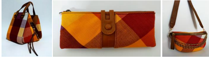
ภาพที่ 4 ผลิตภัณฑ์ต้นแบบชุดเชิ้ตกระเป๋าผ้าขาวม้าโนนบัวทายเป็นที่สร้างเอกลักษณ์ให้กับผลิตภัณฑ์ชุมชนบนฐานของนโยบายเศรษฐกิจสร้างสรรค์และเผยแพร่ให้ชุมชนได้ใช้ประโยชน์

สรุปผลการศึกษาความพึงพอใจที่มีต่อการออกแบบผลิตภัณฑ์ผ้าขาวม้าโนนบัวทายเป็นที่สร้างเอกลักษณ์ให้กับผลิตภัณฑ์ชุมชนบนฐานของนโยบายเศรษฐกิจสร้างสรรค์และเผยแพร่ให้ชุมชนได้ใช้ประโยชน์