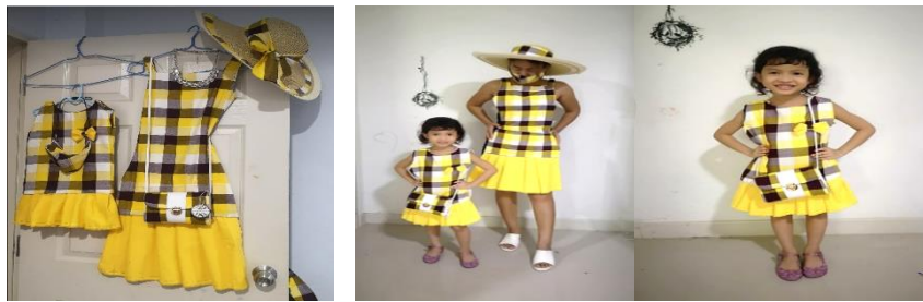
ภาพที่ 5 ผลิตภัณฑ์ต้นแบบชุดเดรสเชิ้ตคุณแม่ - ลูก กระเป๋าสะพาย หมวก และ แมสปิดปากโนนบัวทายเป็นที่สร้างเอกลักษณ์ให้กับผลิตภัณฑ์ชุมชนบนฐานของนโยบายเศรษฐกิจสร้างสรรค์และเผยแพร่ให้ชุมชนได้ใช้ประโยชน์