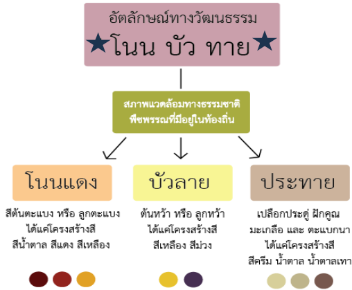
ภาพที่ 7 โครงสร้างสีที่สื่อถึงอัตลักษณ์ทางวัฒนธรรมโนนบัวทาย

ในส่วนของแนวคิดเศรษฐกิจสร้างสรรค์และการพัฒนาผลิตภัณฑ์ชุมชนที่เหมาะสมต่อการออกแบบภายใต้แนวคิดเศรษฐกิจสร้างสรรค์ และเพื่อให้เกิดความยั่งยืนด้านการออกแบบพัฒนาผลิตภัณฑ์ชุมชน นักวิจัยควรมีกิจกรรมในการให้ความรู้เพื่อเพิ่มขีดความสามารถให้กับกลุ่มผู้ผลิตผ่านรูปแบบกิจกรรมต้นน้ำ (ที่มาของแหล่งทุน วัตถุดิบ กระบวนการธุรกิจ) กลางน้ำ (กระบวนการแปรรูป กระบวนการเกิดสินค้า) ปลายน้ำ (กระบวนการสินค้าถึงมือผู้ซื้อ) ในส่วนการศึกษาริบทและประวัติศาสตร์ความเป็นมาของพื้นที่วิจัยเพื่อสร้างและหาอัตลักษณ์ให้กับผลิตภัณฑ์นั้น ๆ ควรมองบริบทของพื้นที่โดยรอบในหลากหลายมิติที่มีความเป็นมาตั้งแต่อดีตจนถึงปัจจุบันรวมถึงการนำความรู้ด้านหลักการออกแบบไปใช้ในการพัฒนาผลิตภัณฑ์ก็ควรสอดคล้องกับขีดความสามารถในฝีมือแรงงานของกลุ่มผู้ผลิตในชุมชนนั้นด้วย