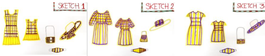
ภาพที่ 2 ภาพร่างแนวคิดการออกแบบชุดเดรสเซตคุณแม่ - ลูก กระเป๋าสะพาย หมวก และแมสปิดपा

ตัวแทนกลุ่มทอผ้าหลากสี ตำบลหนองหัว อำเภอบัวลาย จำนวน 20 คน ต้องการผลิตภัณฑ์ประเภทชุดเซตซึ่งประกอบด้วย ชุดเดรสสำหรับคุณแม่ ชุดเดรสคุณลูก กระเป๋าสะพาย หมวก และแมส ซึ่งผลิตภัณฑ์ที่กลุ่มต้องการนั้นที่ไม่เกินศักยภาพด้านการผลิตเนื่องจากมีพื้นฐานด้านตัดเย็บเป็นอย่างดี กลุ่มเล็งเห็นว่าผลิตภัณฑ์ชุด เดรสคู่สำหรับคุณแม่ และคุณลูก มีความแปลกใหม่ น่าสนใจ และตรงกับความต้องการของตลาดงานผ้าในยุคปัจจุบัน