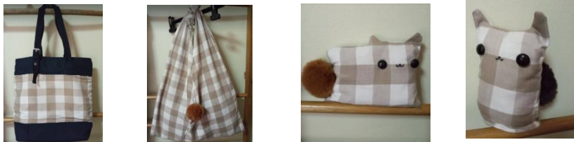
ภาพที่ 6 ผลิตภัณฑ์ต้นแบบกระเป๋าตุ๊กตาผ้าขาวม้าโนนบัวทายเป็นที่สร้างเอกลักษณ์ให้กับผลิตภัณฑ์ชุมชนบนฐานของนโยบายเศรษฐกิจสร้างสรรค์และเผยแพร่ให้ชุมชนได้ใช้ประโยชน์

ตารางที่ 2 ค่าเฉลี่ยความพึงพอใจที่มีต่อการออกแบบผลิตภัณฑ์ผ้าขาวม้าโนนบัวทายเป็นที่ได้จากตัวแทนกลุ่ม ทอผ้าบ้านป่าตะแบง ตำบลดอนยาวใหญ่ อำเภอโนนแดง