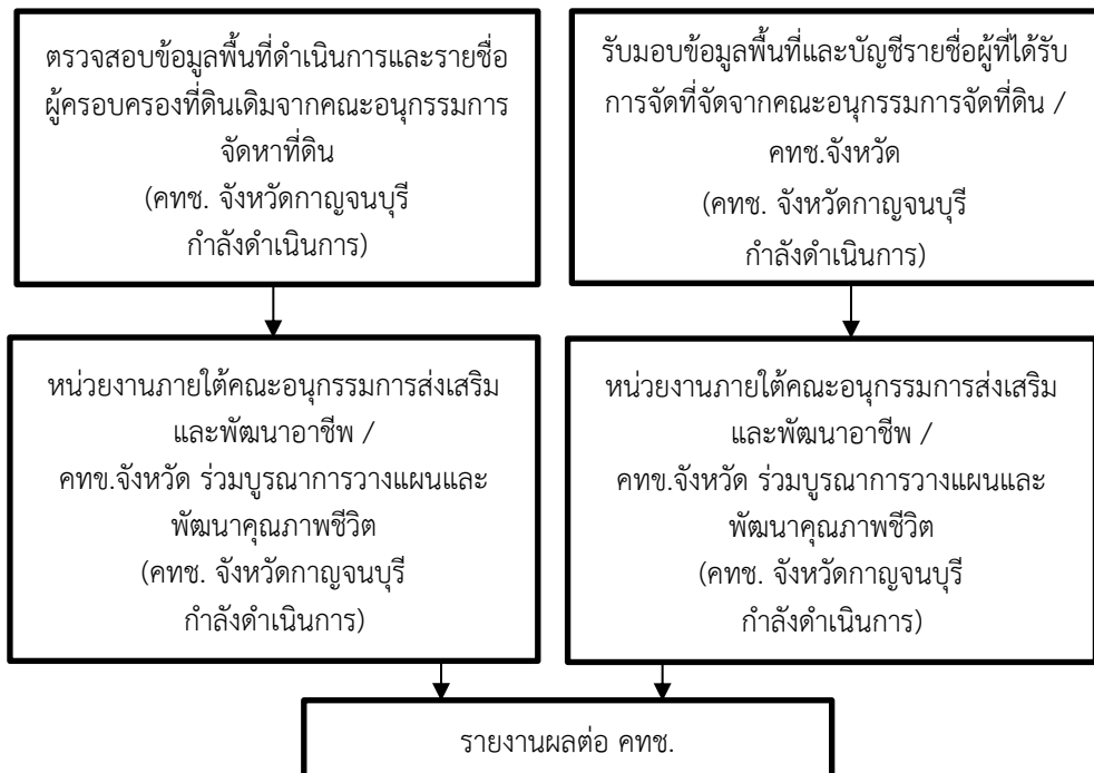
ภาพที่ 1 ขั้นตอนการดำเนินงานของ คทช. จังหวัด

3. การจัดที่ดินของรัฐให้แก่ผู้ยากไร้ ภายใต้การดำเนินงานของ คทช. ให้เป็นไปตามกฎหมายและหลักเกณฑ์ที่หน่วยงานของรัฐ และ คทช. กำหนด ตามภาพที่ 1