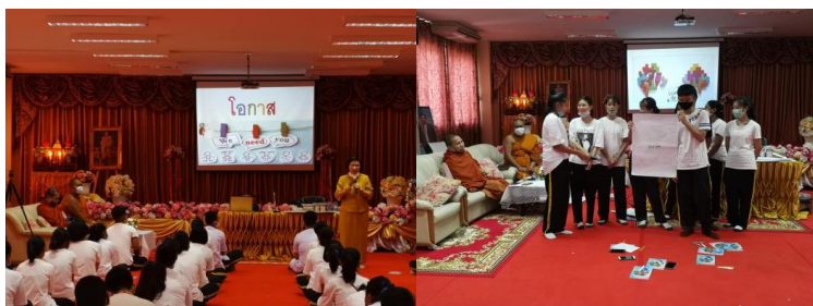
ภาพที่ 4 วิทยากรกระบวนการ พาทำกิจกรรมชุมชนคิด ชวนคุย ชวนทำ

จากข้อความด้านบนของนักเรียนทั้งหมดประมวลเป็นข้อเสนอที่ได้รับการคัดเลือก เพื่อให้ให้นักเรียนผู้เข้ารับการอบรมได้ลงมือปฏิบัติ หรือเพื่อการลงมือปฏิบัติ ซึ่งเป็นความคาดหวังจากคณะนักวิจัยว่านักเรียนสามารถลงมือทำได้ และคณะครูผู้ทำหน้าที่ในการกำกับเป็นพี่เลี้ยงก็สังเกตเห็นว่าเป็นประโยชน์ และนักเรียนได้รับการสนับสนุนให้เกิดเป็นกิจกรรมภายใต้แนวคิดเยาวชนสร้างสรรค์ พวกเราทำได้