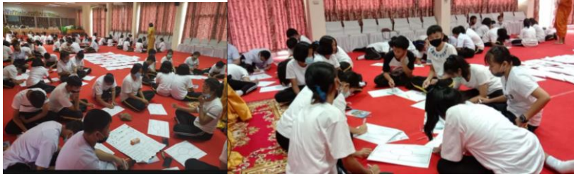
ภาพที่ 5 นักเรียนชุมชนป้อมเพชรกับกิจกรรมสะท้อนคิด ดึงศักยภาพของตัวเองเพื่อการออกแบบชุมชนสร้างสรรค์

โดยกิจกรรมเน้นการฝึกให้นักเรียน/เยาวชน ได้แสวงหาคำศักยภาพตัวเอง (อัตตศึกษา) มีความรู้ มีความสามารถอะไร ทำอะไรได้บ้าง แนวคิดตนที่เป็นประโยชน์ (อรรถ-ประโยชน์) นำสิ่งที่ตัวเองมีทำได้ไปสร้างมูลค่า นำไปพัฒนาให้เป็นประโยชน์สำหรับตนเอง สังคม และส่วนรวม (ปรหิตประโยชน์) ภายใต้วินัย รู้ คิด ทำ นำไปพัฒนา เป็นประโยชน์สำหรับส่วนรวม ดังนั้นความสร้างสรรค์ หรือการคิดอย่างสร้างสรรค์เกิดได้จากการเห็น เกิดได้จากการเลียนแบบ และเกิดได้จากแนวคิดที่เป็นประโยชน์สำหรับเรียนรู้สิ่งที่เกิดขึ้นด้วย