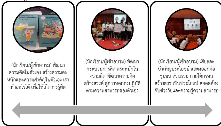
ภาพที่ 7 ผังถอดความคิดต่อการฝึกอบรมชุมชนสร้างสรรค์ ที่สอดคล้องกับศักยภาพและความสามารถของนักเรียนโรงเรียนชุมชนป้อมเพชร

จากการดำเนินกิจกรรมทำให้ได้ข้อค้นพบหลายประการ อาทิ (1) การฝึกอบรม ทำให้เกิดการภาคีเพื่อการพัฒนาการเรียนรู้ร่วมกัน ระหว่างคณะนักวิจัย วิทยากร และโรงเรียน เป็นการจัดกิจกรรมโครงการภายใต้การประสานร่วมมือโดยมีเป้าหมายเป็นการพัฒนา “เด็ก-เยาวชน” สู่การสะท้อนคิด ชวนทำชวนปฏิบัติร่วมกัน ผลได้เชิงประจักษ์ ทำให้นักเรียนผู้เข้ารับการอบรมกล้าคิด กล้าทำ และกล้าแสดงออก ภายใต้พื้นที่จัดสรรค้ำขึ้นมา ไม่ว่าจะเป็นพื้นที่กลาง พื้นที่สร้างสรรค์ ภายใต้ขอบเขตของความคิดเพื่อการพัฒนาตัวนักเรียนเอง (2) การสร้างพื้นที่ให้เกิดการพัฒนาตัวเองของนักเรียน คิดได้ ทำได้ และแสดงออกได้ บนฐานของการกระตุ้นส่งเสริม และให้คำแนะนำอย่างต่อเนื่องระหว่างครู คณะนักวิจัย สู่การศึกษา พัฒนา และเรียนรู้ไปพร้อม ๆ กัน ระหว่างครู นักเรียน ชุมชน (3) การสร้างพื้นที่จำลองเพื่อตั้งศักยภาพและสร้างศักยภาพทางการกระทำ เป็นแนวคิดแนวทางสร้างสรรค์ให้กับนักเรียน เป็นการสร้างพื้นที่เสมือนจริงภายใต้การทดลองปฏิบัติ ซึ่งผลจากความคาดหวังนักเรียนจะเป็นเมล็ดพันธุ์ของความเติบโต ไปพร้อมเวลา ซึ่งมีเป้าหมายเป็นการพัฒนาตัวเอง กระทำในสิ่งที่สร้างสรรค์ เป็นประโยชน์ สำหรับตนเอง (อัตตัตถะ) โรงเรียน ชุมชนที่น้อง ๆ นักเรียนอยู่อาศัย สังคม (ปรัตถะ) และองค์รวมคือประเทศชาติ (อุภยัตถะ) ในฐานะเยาวชนคนรุ่นต่อไปของสังคมนี้ บนฐานคิด “ทำเพื่อประโยชน์ของส่วนรวมและสร้างสรรค์” เป็นหมุดหมายของการฝึกอบรมและพัฒนานี้ด้วยเช่นกัน