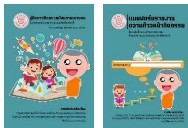
ภาพที่ 2 คู่มือฝึกอบรม

ในกิจกรรมปฏิบัติการในพื้นที่วิจัยโรงเรียนชุมชนป้อมเพชร ได้มีการเชิญวิทยากร นักฝึกอบรม เชิงปฏิบัติมาเป็นวิทยากรกระบวนการ ที่เน้นให้นักเรียนได้แสดงออก กล้าคิด กล้าทำ โดยกรอบคือการนำทำกิจกรรมให้นักเรียนที่เป็นกลุ่มเป้าหมายของการฝึกอบรม โดยกลุ่มเป้าหมายเป็นนักเรียนชั้น มัธยมศึกษาปีที่ 4 จำนวน 100 คนโดยประมาณ ซึ่งเป็นนักเรียนใหม่ที่เพิ่งเข้ารับการศึกษาระดับการศึกษา 2563 ที่เพิ่งจะเข้าสู่ระบบโรงเรียน ด้วยสาเหตุของการแพร่ระบาดของไวรัสโคโรนา 19 ทำให้นักเรียนหายไปจากห้องเรียน และมีนักเรียนเพิ่มเข้ามาโดยเป็นนักเรียนจากต่างอำเภอที่เข้ามาเรียนที่โรงเรียนนี้ กรอบการอบรมมีเป้าหมายให้ (1) นักเรียนกล้าคิดกล้าทำในกรอบที่ส่งเสริม (2) ใช้ความคิดสร้างสรรค์ในการพัฒนาตนเอง และพัฒนาชุมชนที่อยู่อาศัย (3) ฝึกการตระหนักและเห็นความสำคัญของการทำงานเพื่อชุมชนและสังคมส่วนรวม ซึ่งในกิจกรรมที่วิทยากรที่ได้รับเชิญมาคือ อาจารย์ณรงค์ลักษณ์ ไชเสโน ผู้อำนวยการสถาบันบริหารสารสนเทศและการจัดการความรู้ (สสร.) โดยดำเนินกิจกรรมใน 3 ชุดฝึกตามเอกสารคู่มือภาพประกอบ 2 ซึ่งวิทยากรได้ดำเนินการคือ