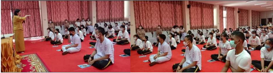
ภาพที่ 3 วิทยากรกระบวนการ พาทำกิจกรรมชุมชนคิด ชวนคุย ชวนทำ

ความเป็นไปได้ และขับเคลื่อนให้เกิดการทำงานร่วมกัน และส่งเสริมให้เกิดพลังในการทำกิจกรรมร่วมกัน