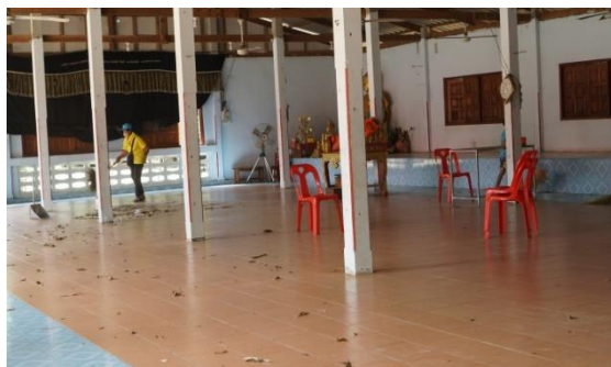
ภาพที่ 5 ลงมือปฏิบัติ Big Cleaning Day บริเวณศาลา

7. สรุปผลการดำเนินงาน ผลจากการดำเนินกิจกรรมโครงการวัด ประชา รัฐ สร้างสุข ด้วยกิจกรรม 5 ส ขององค์การบริหารส่วนตำบลระบำ อำเภอลานสัก จังหวัดอุทัยธานี ทำให้เกิดความสงบสุขร่วมเย็นเป็นระเบียบภายในวัดและชุมชน (สัปปายะ) อาทิ อาวาสสัปปายะ มีสถานที่จัดรถพ่วงเพียง อาหารสัปปายะ มีการควบคุมคุณภาพอาหารและเครื่องดื่ม บุคคลสัปปายะ มีการฝึกอบรมและพัฒนาพระสงฆ์สามเณร และธรรมสัปปายะ การให้คำปรึกษาผู้ร่วมงานในการปฏิบัติงาน นอกจากนี้ ยังเป็นปัจจัยพื้นฐานการบริหารคุณภาพที่จะช่วยสร้างสภาพแวดล้อมที่ดีในที่ทำงานให้เกิดบรรยากาศที่น่าทำงาน เกิดความสะอาดเรียบร้อยในสำนักงาน ถูกสุขลักษณะ ทำให้พนักงานสามารถใช้ศักยภาพของตนเองได้อย่างเต็มความสามารถ สร้างทัศนคติที่ดีของพนักงานต่อหน่วยงาน นอกจากนี้ ยังมีความสำคัญต่อการพัฒนาท้องถิ่น คือ มีกระบวนการการจัดการใหม่ที่ดีคั่น และพัฒนาจากองค์ความรู้และประสบการณ์ของชุมชน เพื่อแก้ปัญหาการประกอบอาชีพ การเพิ่มประสิทธิภาพการผลิต และการเสริมสร้างสุขภาวะอย่างเป็นระบบตามภูมิสังคมของชุมชน ก่อให้เกิดประโยชน์ต่อเศรษฐกิจและสังคม ตามแนวทางเศรษฐกิจพอเพียงและการพัฒนาที่ยั่งยืน