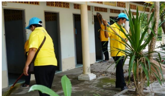
ภาพที่ 4 การลงมือปฏิบัติ Big Cleaning Day บริเวณห้องน้ำวัด