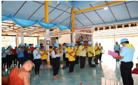
ภาพที่ 2 พิธีเปิด

ซึ่งในแต่ละขั้นตอนของกิจกรรมแสดงเป็นภาพประกอบ ได้ดังนี้