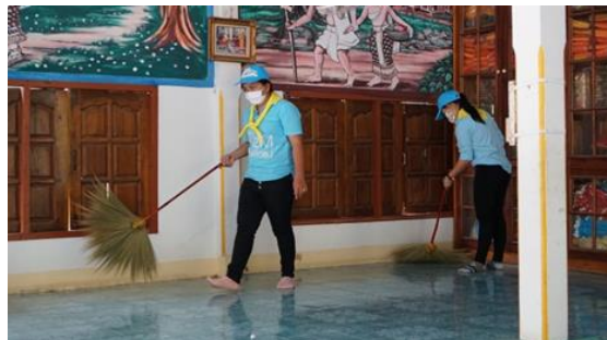
ภาพที่ 3 การลงมือปฏิบัติ Big Cleaning Day บริเวณวัด