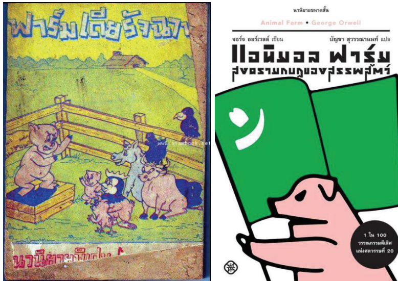
แผนภาพที่ 2: หนังสือ Animal Farm ที่ถูกแปลในภาษาไทยในช่วงเวลาที่ต่างกัน ฟาร์มเดี่ยวร้างมาและสงครามกบฏของสรรพสัตว์

(พ.ศ. 2549) แอนิมอล ฟาร์ม สงครามกบฏของสรรพสัตว์ แปลโดย บัญชา สุวรรณานนท์ สำนักหนังสือไต้ฝุ่น (พ.ศ. 2555) และฉบับของสำนักพิมพ์มติชน แปลโดย เกียรติขจร ไซแสงสุขกุล ในส่วนที่นำมาเป็น Books Reviews ในเล่มนี้ (2560) ที่สะท้อนว่าเป็นหนังสือที่ได้รับความนิยมและถูกถ่ายทอดแปลซ้ำในภาคภาษาไทยและภาษาต่างประเทศจำนวนมาก