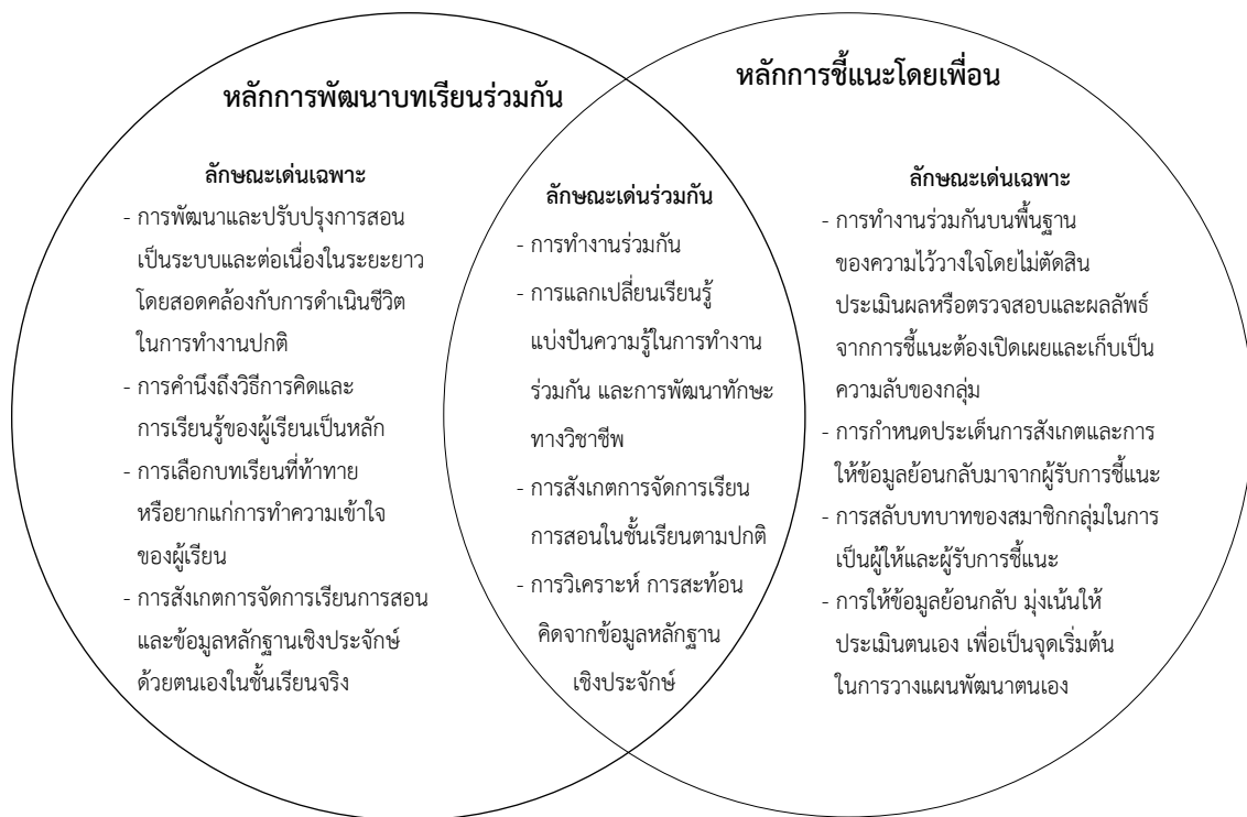
ภาพประกอบ 2 การวิเคราะห์หลักการพัฒนาบทเรียนร่วมกันและหลักการชี้แนะโดยเพื่อน

การทำความเข้าใจของผู้เรียน การสังเกต การจัดการเรียน การสอนและข้อมูลหลักฐานเชิงประจักษ์ด้วยตนเอง ในชั้นเรียนจริง หลักการของการชี้แนะโดยเพื่อนของ National Union of Teachers (2013) มีลักษณะเด่นเฉพาะในเรื่องการทำงานร่วมกันบนพื้นฐานของความไว้วางใจโดยไม่ตัดสินประเมินผลหรือตรวจสอบและผลลัพธ์จากการชี้แนะต้องเปิดเผยและเก็บเป็นความลับของกลุ่ม การกำหนดประเด็นการสังเกตและการให้ข้อมูลย้อนกลับมาจากผู้รับการชี้แนะการสลับบทบาทของสมาชิกกลุ่มในการเป็นผู้ให้และผู้รับการชี้แนะการให้ข้อมูลย้อนม่งเน้นให้ประเมินตนเองเพื่อเป็นจุดเริ่มต้นในการวางแผนพัฒนาตนเอง หลักการของการพัฒนาบทเรียนร่วมกันของ Stigler & Hiebert (1999) และหลักการของการชี้แนะโดยเพื่อนของ National Union of Teachers (2013) มีลักษณะเด่นร่วมกันในเรื่องการทำงานร่วมกัน การแลกเปลี่ยนเรียนรู้ แบ่งปันความรู้ในการทำงานร่วมกันและการพัฒนาทักษะทางวิชาชีพ การสังเกตการจัดการเรียนการสอนในชั้นเรียนตามปกติ การวิเคราะห์ การสะท้อนคิดจากข้อมูลหลักฐานเชิงประจักษ์ จากผลการวิเคราะห์ข้างต้นสามารถสรุปได้ดังภาพประกอบ 2