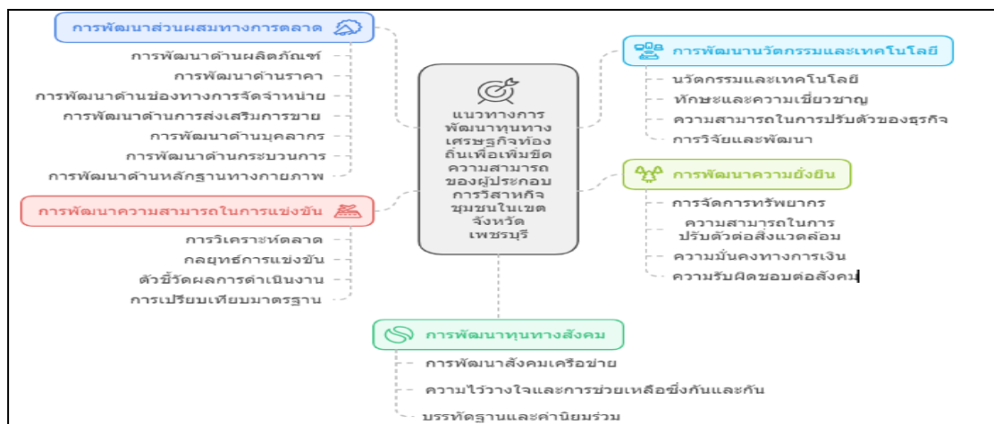
ภาพที่ 3 แนวทางการพัฒนาทุนทางเศรษฐกิจท้องถิ่นเพื่อเพิ่มขีดความสามารถของผู้ประกอบการวิสาหกิจชุมชนในจังหวัดเพชรบุรี

2. ผลการศึกษาการสร้างแนวทางการพัฒนาทุนทางเศรษฐกิจท้องถิ่นเพื่อเพิ่มขีดความสามารถของผู้ประกอบการวิสาหกิจชุมชนในเขตจังหวัดเพชรบุรี