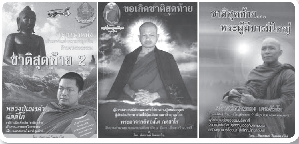
ภาพที่ 2 สื่อสิ่งพิมพ์ที่พยายามทำให้เชื่อว่าจะเป็นพระอรหันต์ ตามคติทางพระพุทธศาสนา ด้วยคำว่า “ชาติสุดท้าย” [ภาพออนไลน์ : 15 ต.ค.56]