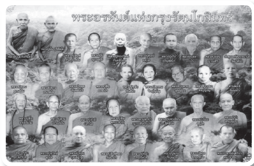
ภาพที่ 3 “สิ่งสร้าง” ที่มีผู้พยายามทำให้เชื่อว่า “พระอรหันต์” มีอยู่ในสังคมไทย ที่ย้อนไปไม่น่าจะเกิน 100 ปี [ภาพออนไลน์ : 15 ต.ค.56]

เกิดการยอมรับ (Adaptation) เป็นชุดคิด ความเชื่อทางสังคม โดยไม่มีการตรวจสอบด้วยความจริงเชิงประจักษ์อย่างเป็นระบบ จึงส่งผลให้เกิดปรากฏการณ์ “ขบวนการพระอรหันต์” ทั้งจริงและไม่จริง? ดังคำตอบของเจ้าของผลิตภัณฑ์ “ดอกบัวคู่” ผู้อุปถัมภ์เนรค่า ให้สัมภาษณ์ว่า “เชื่อ-ศรัทธาเต็มหัวใจ”ว่าเป็นพระอรหันต์ (รายการทีลึบ 3 กันยายน 2556 ช่อง 3 เวลา 22.00-24.00 น. : online) รวมทั้งพฤติกรรมและการกระทำบางอย่าง ที่มีส่วนสนับสนุนการสร้างความสำเร็จให้คนอื่น ๆ อีก กรณีการปรากฏตัวในการทำงานพิธี การมีชื่อเป็นผู้บริจาครถยนต์ เป็นต้น