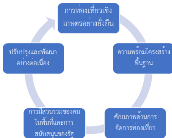
Picture 3: Assessment of Agro-Tourism Potential in Mueang District, Uthai Thani Province

จากการประเมินศักยภาพแหล่งท่องเที่ยวเชิงเกษตร อำเภอมือง จังหวัดอุทัยธานี เริ่มจากการทำสำรวจศักยภาพด้านการจัดการท่องเที่ยวในอำเภอมือง จังหวัดพทุมธานี ทำให้ทราบการเชื่อมโยงระหว่างนักท่องเที่ยวกับวิถีเกษตรกร โดยให้ผู้มาเยือนมีส่วนร่วมในกิจกรรมทางเกษตร เช่น การปลูกผัก การเก็บเกี่ยว ผลผลิตปลาแรดแม่น้ำสะแกกรัง การแปรรูปมะม่วงพันธุ์งามเมืองย่า หรือการเรียนรู้วัฒนธรรมท้องถิ่นอาหารที่สืบทอดกันมา มีการนำนวัตกรรมมาประยุกต์ใช้ในการผลิตโดยใช้ตู้อบพลังงานแสงอาทิตย์มาแปรรูปผลผลิต ทำให้นักท่องเที่ยวเข้าใจบริบทของวัฒนธรรม เห็นคุณค่าของสินค้าเกษตร ส่งเสริมความภาคภูมิใจในวิถีชีวิตดั้งเดิม ในขณะที่แหล่งท่องเที่ยวต้องมีความพร้อมและพัฒนาสินค้าเกษตร เพื่อสร้างการดึงดูดใจนักท่องเที่ยวให้กลับมาเที่ยวซ้ำ เพื่อพัฒนาแหล่งท่องเที่ยวให้เกิดความยั่งยืน