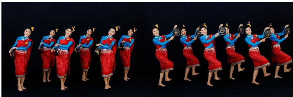
Picture 1: Show Ti Gong Dance, it is the Uniqueness of the Display Showing the Community Producing Gong at Ban Sai Mun.

เสื้อผ้าการแสดงออกแบบประยุกต์จากผ้าพื้นเมืองของชาวอีสานโดยตัดเย็บจากช่างในชุมชน และเพิ่มเติมเอกลักษณ์โดยเครื่องประดับและอุปกรณ์การแสดง