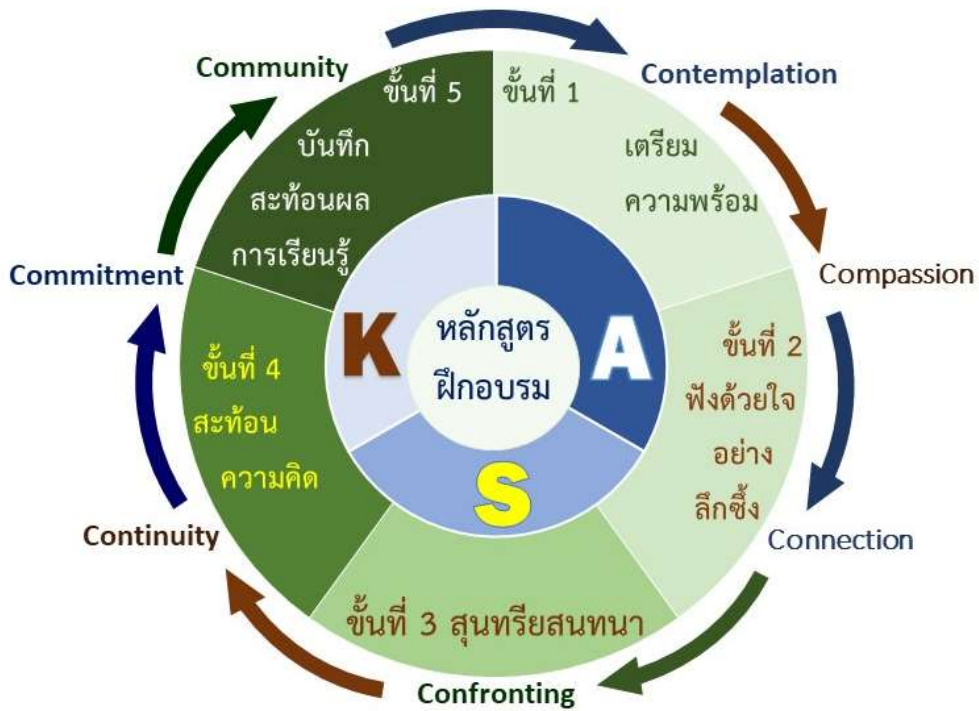
ภาพที่ 1 กระบวนการจัดกิจกรรมการฝึกอบรมเสริมสร้างสมรรถนะการจัดการชั้นเรียน