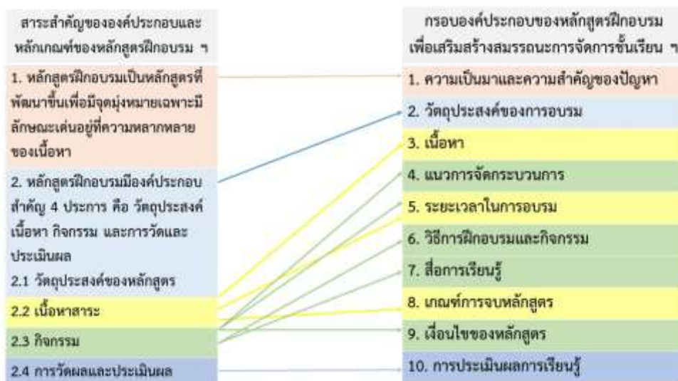
ภาพที่ 2 กรอบแนวคิดในการพัฒนาหลักสูตรฝึกอบรม

ผลการสังเคราะห์องค์ความรู้เพื่อกำหนดแนวทางการพัฒนาหลักสูตรฝึกอบรม ได้แก่ ความเป็นมาและความสำคัญของปัญหา วัตถุประสงค์ของการอบรม เนื้อหา แนวการจัดกระบวนการ ระยะเวลาในการอบรม วิธีการฝึกอบรมและกิจกรรม สื่อการเรียนรู้ เกณฑ์การจบหลักสูตร เงื่อนไขของหลักสูตร และการประเมินผล การเรียนรู้ เป็นกรอบแนวคิดในการพัฒนาหลักสูตรฝึกอบรม ดังภาพที่ 2