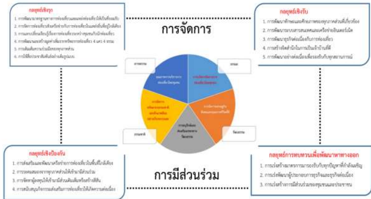
ภาพที่ 3 องค์ความรู้จากการวิจัย

จากผลการวิจัยเรื่อง “ต้นน้ำเจ้าพระยากับการพัฒนาสู่เศรษฐกิจฐานรากทางการท่องเที่ยวอย่างยั่งยืน” ผู้วิจัยขอสรุปองค์ความรู้จากการวิจัย ดังนี้