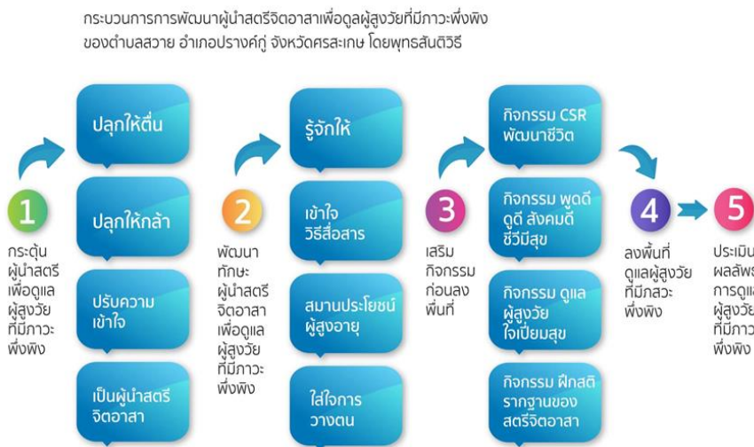
แผนภาพที่ 1 : กระบวนการพัฒนาผู้นำสตรีจิตอาสาเพื่อดูแลผู้สูงวัยที่มีภาวะพึ่งพิงของตำบลสวาย

ทั้ง 5 กระบวนการนี้ สามารถสรุปเป็นโมเดลประกอบการดำเนินงานมีรายละเอียดได้ดังนี้