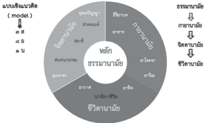
แผนภูมิที่ 2 องค์ความรู้ใหม่จากการวิจัย

จากแผนภูมิที่ 2 องค์ความรู้ใหม่จากการวิจัยสามารถสรุปได้ดังต่อไปนี้