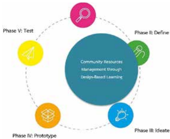
ภาพประกอบ 1 รูปแบบการจัดการทรัพยากรชุมชนผ่านการเรียนรู้เชิงออกแบบเป็นฐาน ที่มา: ปรับปรุงจาก Brunetto (2018)

ขั้นตอนที่ 1 เข้าใจบริบทพื้นที่ (Empathize) เป็นการศึกษาและทำความเข้าใจสภาพชุมชนและภูมิศาสตร์ของชุมชนตนเอง