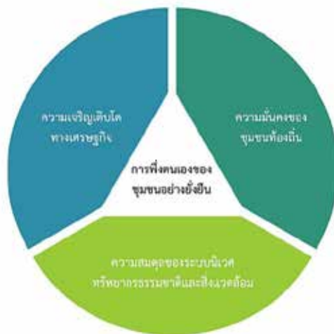
ภาพประกอบ 2 เป้าหมายหลักของการพึ่งตนเองบนฐานทรัพยากรชุมชนอย่างยั่งยืน

ดังนั้นการพึ่งตนเองของชุมชนอย่างยั่งยืน จึงเป็นกระบวนการที่จะทำให้คนในชุมชนสามารถ 1) ช่วยเหลือตนเองและช่วยเหลือซึ่งกันและกันภายในชุมชน โดยใช้สติปัญญาหรือภูมิปัญญาท้องถิ่นผสมผสานกับเทคโนโลยี และ 2) การใช้ประโยชน์จากฐานทรัพยากรที่มีอยู่ในชุมชนในการแก้ไขปัญหา โดยคำนึงถึงประโยชน์ส่วนรวมมากกว่าส่วนตน เพื่อให้เกิดการสร้างคุณค่า (Value) และมูลค่า (Price) และการรวมกลุ่มในรูปแบบต่าง ๆ ซึ่งเป็นความสามารถในการสร้างอำนาจต่อรองกับภายนอก เพราะเมื่อชุมชนเข้มแข็งและพึ่งตนเองได้ คนในชุมชนก็จะเข้มแข็ง และเกิดการพึ่งตัวเองได้อย่างยั่งยืน โดยมีเป้าหมายหลักคือเพื่อเสริมสร้าง 1) ความเจริญทางด้านเศรษฐกิจ 2) ความมั่นคงของชุมชนท้องถิ่น และ 3) ความสมดุลของระบบนิเวศ ทรัพยากรธรรมชาติและสิ่งแวดล้อม