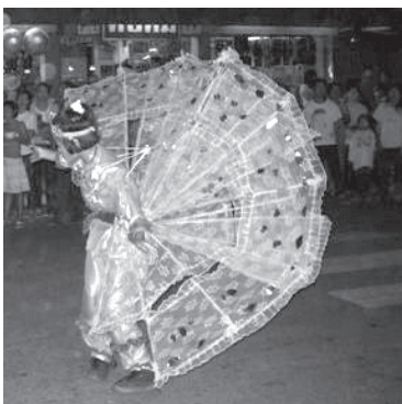
การฟ้อนนางนก