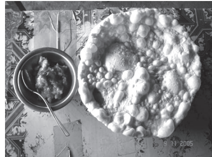
ภาพของอาหาร ผัก ชนิดต่าง ๆ ที่นำมาชุบแป้งทอด ข้าวแรมฟืนหรือข้าวฟืน และ โรตีสอ้อ

ประวัติศาสตร์เมืองเชียงใหม่ พงศาวดารเมืองเชียงใหม่ กล่าวไว้ว่า พ.ศ. 1772 พระ ยามังรายประพาสาปและไล่กวางทองมาจากเมืองเชียงใหม่ พระองค์เสด็จเห็นภูมิประเทศก็ พอพระทัย สั่งให้ข้าราชการบริวารสลักรูปคนจูงหมาพาไถแบกธนูไว้เป็นที่ระลึก ต่อมาได้ ให้ขุนคงและขุนลัง มาชิงเมืองจากชาวละแ้วแต่ไม่สำเร็จ จึงส่ง มังคุม มังเคียน ซึ่งเป็นชาว ละแ้วมารบอีกครั้งหนึ่งก็รบชนะ ในชั้นแรกพระยามังรายให้มังคุมมังเคียนครองเมือง ภาย