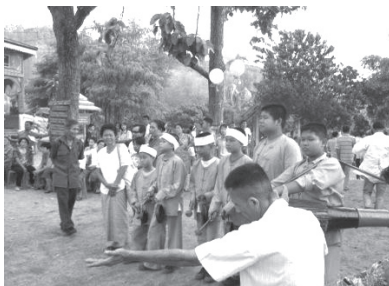
การฟ้อนก้าลายแล้ว

เคยมานาน ชาวไทใหญ่มักจะเรียกตนเองว่า “ไต” และจำแนกกลุ่มด้วยการเพิ่มคำขยาย เช่น ไทดำ ไทแดง ไทขาว ไทใต้ ไทเหนือ เป็นต้น ศิลปและวัฒนธรรมคล้ายคลึงกับไทเงิน ไทลื้อ กล่าวคือยังมีกิจกรรมการฟ้อน การรำ เช่นเดียวกัน