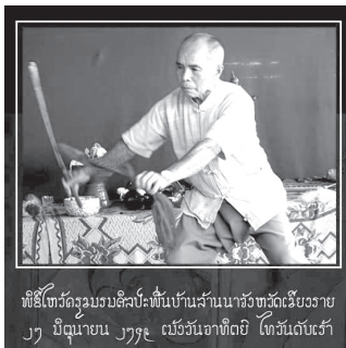
ภาพการฟ้อนดาบ