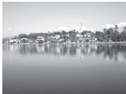
วัดจอมคำ บริเวณรอบหนองตุง และกลุ่มบ้านไทเงิน