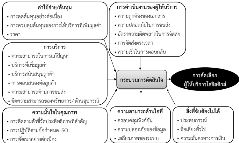
ภาพที่ 2 กรอบแนวคิดการวิจัย