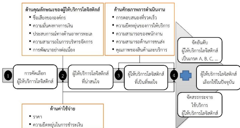
ภาพที่ 4 แบบจำลองความคิดการคัดเลือกผู้ให้บริการโลจิสติกส์ กรณีศึกษาผู้ประกอบการอาหารทะเล

ผู้ให้บริการโลจิสติกส์ที่พอใจ ขั้นตอนนี้เป็นการจัดสรรกระจายว่าจะเลือกใช้ผู้ให้บริการรายใด ปัจจัยด้านศักยภาพการดำเนินงานเป็นปัจจัยหลักที่มีความสำคัญ ประกอบด้วย 5 ปัจจัย คือ การตอบสนองที่รวดเร็ว ความยืดหยุ่นของการให้บริการ ความสามารถของพนักงาน ความสามารถด้านการขนส่ง และคุณภาพของสินค้าและบริการ ผู้ให้บริการโลจิสติกส์รายที่มีศักยภาพการดำเนินงานสูงกว่าจะถูกเลือกใช้บริการก่อนเสมอ ทั้งนี้ ผู้ให้บริการรายนั้นต้องสามารถดำเนินกิจกรรมนั้น ๆ ให้สามารถตอบสนองความต้องการของลูกค้าได้ และ (4) การใช้บริการผู้ให้บริการโลจิสติกส์ เป็นขั้นตอนการใช้และประเมินผู้ให้บริการโลจิสติกส์ เพื่อนำผลการประเมินไปใช้เป็นตัวกำหนดระดับรูปแบบความสัมพันธ์ทางธุรกิจในอนาคตต่อไปว่าจะหยุดใช้บริการ ลดสัดส่วนการจัดสรรงาน หรือยังคงรักษาสัดส่วนการจัดสรรงาน โดยปัจจัยหลักที่ใช้พิจารณา คือ ด้านศักยภาพการดำเนินงาน ซึ่งแต่ละสถานประกอบการจะมีเกณฑ์แตกต่างกันตามแต่ละกิจกรรมโลจิสติกส์ที่เลือกใช้ในการกำหนดระดับคุณภาพสินค้าและบริการของผู้ให้บริการโลจิสติกส์รายนั้น ๆ