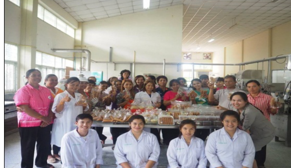
ภาพที่ 12 ผลสำเร็จของหมู่บ้านราชมงคลอีสาน ด้านสังคม

ด้านสิ่งแวดล้อม คนในชุมชนตระหนักถึงความสำคัญของรักษาสิ่งแวดล้อม สร้างจิตสำนึกในการดูแลรักษา ฟื้นฟูป่าและต้นน้ำ ตามแนวพระราชดำริ โดยร่วมกันปลูกป่าชุมชน และสร้างกฎกติกาในการใช้พื้นที่และรักษาป่าชุมชนเพื่อให้มีทรัพยากรธรรมชาติที่อุดมสมบูรณ์คงอยู่ต่อไป รวมถึงการลดใช้สารเคมีทางการเกษตร ปรับเปลี่ยนมาทำเกษตรปลอดภัย เกษตรอินทรีย์เพิ่มมากขึ้น ดังตัวอย่างหมู่บ้านศาลาเกิดป่าชุมชน และเป็นหมู่บ้านเกษตรอินทรีย์ของจังหวัดสุรินทร์ (ภาพที่ 13)