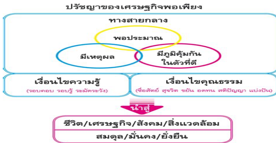
ภาพที่ 1 แนวคิดเศรษฐกิจพอเพียงสู่ชีวิตที่มั่นคงและยั่งยืน 3 ห่วง 2 เงื่อนไข

มหาวิทยาลัยฯ ตระหนักถึงความสำคัญปรัชญาขององค์พระบาทสมเด็จพระบรมชนกาธิเบศร มหาภูมิพลอดุลยเดชมหาราช บรมนาถบพิตร หรือที่เรียกกันว่า ศาสตร์พระราชา โดยเน้นที่สร้างความพอเพียงกับตัวเอง (Self Sufficiency) อยู่ได้โดยไม่ต้องเดือดร้อน ด้วยการนำองค์ประกอบของเศรษฐกิจพอเพียง ตามแนวทางเศรษฐกิจพอเพียง 3 ห่วง 2 เงื่อนไข มาใช้ในการพัฒนาหมู่บ้านราชวมงคล (ภาพที่ 1) เพื่อสร้างให้เกิดเป็นหมู่บ้านราชวมงคลอีสานต้นแบบ