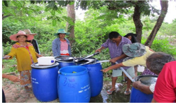
ภาพที่ 13 ผลสำเร็จของหมู่บ้านราชมงคลอีสาน ด้านสิ่งแวดล้อม

ด้านวัฒนธรรม หมู่บ้านดงมัน เกิดการอนุรักษ์ ฟื้นฟู สืบสาน สร้างสรรค์ ส่งเสริมศิลปะอันเป็นภูมิปัญญาท้องถิ่นและเป็นสมบัติของชุมชน รวมถึงเผยแพร่ศิลปวัฒนธรรมต่อสาธารณชน ให้เห็นถึงคุณค่าและวัฒนธรรมท้องถิ่น เพื่ออนุรักษ์และนำไปเป็นวิถีในการดำรงชีวิตที่ดีงามและคงอยู่อย่างยั่งยืนต่อไป (ภาพที่ 14)