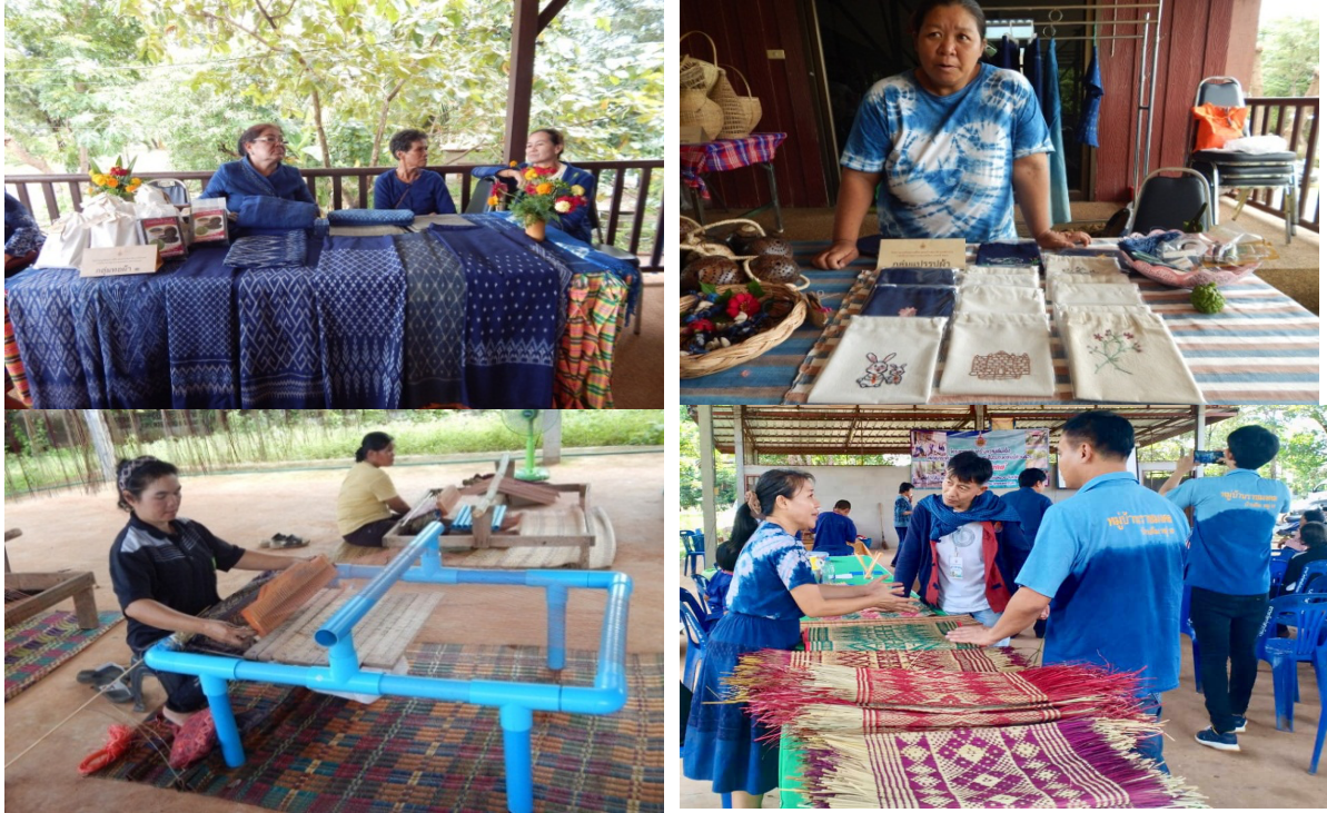
ภาพที่ 9 ประเมินหมู่บ้านราชมงคล

1.5 นำผลการประเมินไปปรับปรุงและพัฒนากระบวนการดำเนินงานหมู่บ้านราชมงคลอีสาน เป็นขั้นตอนที่คณะทำงานช่วยกันระดมสมอง เพื่อร่วมกันพัฒนากระบวนการดำเนินงาน ร่วมกันกำหนด กฎเกณฑ์ กำหนดแนวทาง และรูปแบบการดำเนินการพัฒนาในปีต่อไป เช่น กำหนดหัวข้อในการอบรม กำหนดเกณฑ์การประเมินต่าง ๆ เพื่อให้ผลการพัฒนาเกิดประสิทธิภาพ ประสิทธิภาพ และเกิดประโยชน์สูงสุด ต่อทุกภาคส่วน (ภาพที่ 10)