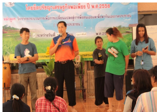
ภาพที่ 2 อบรมปรับกระบวนการทัศนแนวคิดการพัฒนาชุมชนตามศาสตร์พระราชา