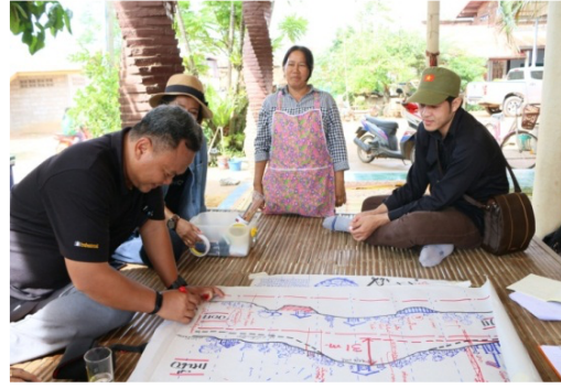
ภาพที่ 3 ฝึกอบรมเชิงปฏิบัติการศึกษาริบทชุมชนและวิเคราะห์ชุมชน