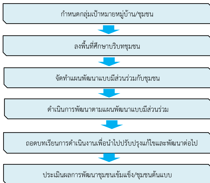
ภาพที่ 8 ขั้นตอนการดำเนินงานหมู่บ้านราชมงคลอีสาน

1.4 ติดตามและประเมินผลการดำเนินงานหมู่บ้านราชมงคลอีสาน (ภาพที่ 9) เพื่อนำไปใช้ในการจัดสรรทุนในปีต่อ ๆ ไป และเพื่อประเมินความคุ้มค่าของการจัดโครงการ โดยหน่วยงานหลักร่วมกับคณะกรรมการประเมินผลการดำเนินงานโครงการหมู่บ้านราชมงคลอีสาน หมู่บ้านที่จะได้รับการพิจารณาจัดสรรทุนพัฒนาหมู่บ้านในปีต่อไป ต้องผ่านเกณฑ์การประเมิน 50 คะแนนขึ้นไป โดยมีหลักเกณฑ์การประเมินดังนี้