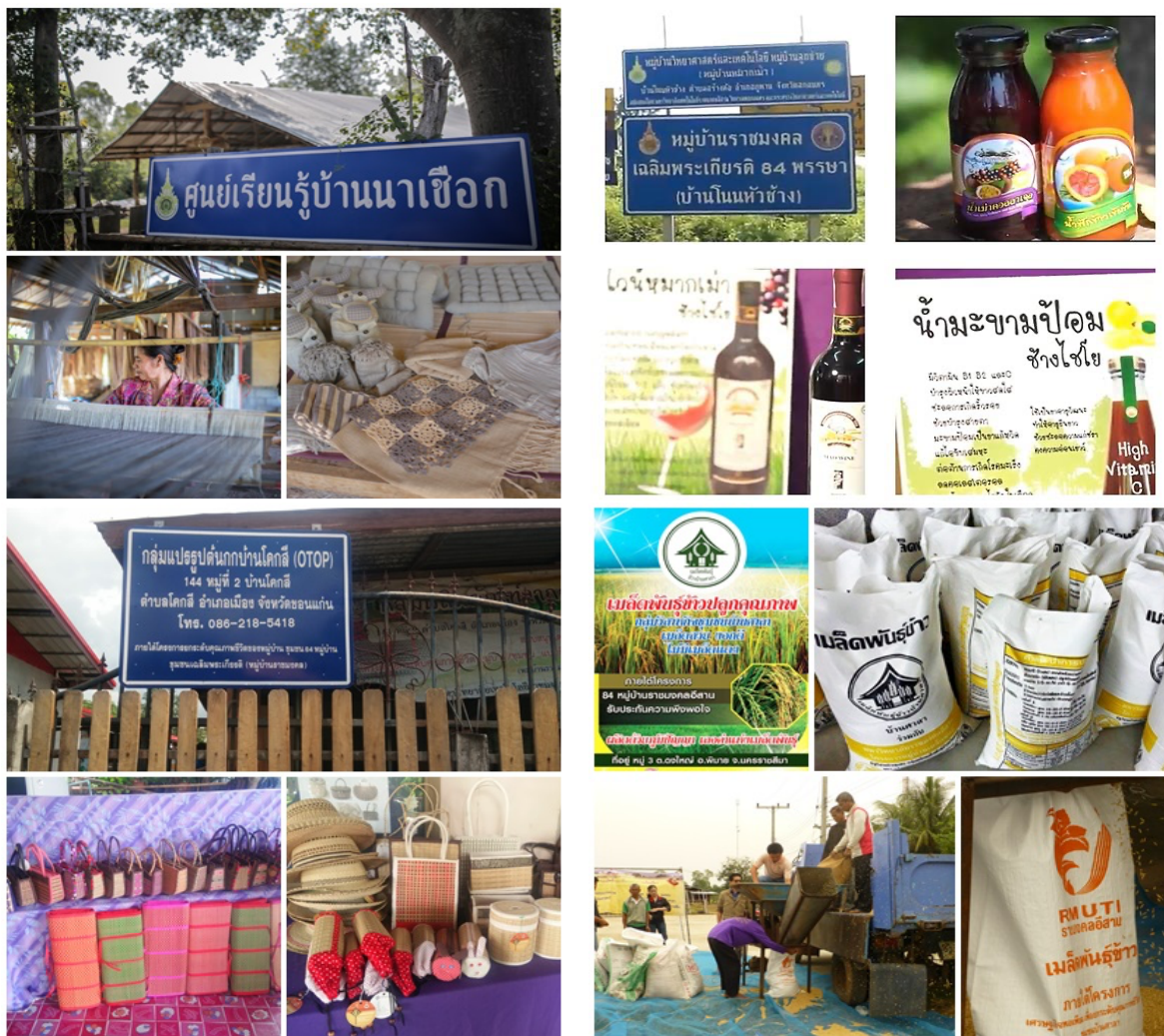
ภาพที่ 11 ผลสำเร็จของหมู่บ้านราชมงคลอีสาน ด้านเศรษฐกิจ

ด้านสังคม เกิดการเปลี่ยนแปลงวิถีชีวิต ประชาชนชาวบ้าน การพึ่งพาอาศัยซึ่งกันและกันในชุมชน ช่วยเหลือเกื้อกูลกัน เกิดจิตสำนึก ความรับผิดชอบ รู้รักสามัคคี ร่วมกันในชุมชน ส่งผลให้ชุมชนน่าอยู่ยิ่งขึ้น ดังตัวอย่างผู้นำหมู่บ้านศาลา ได้รับพระราชทานปริญญาวิทยาศาสตรดุษฎีบัณฑิตกิตติมศักดิ์ (นวัตกรรมการและเทคโนโลยีการเกษตร ประจำปีการศึกษา 2561 (ภาพที่ 12)