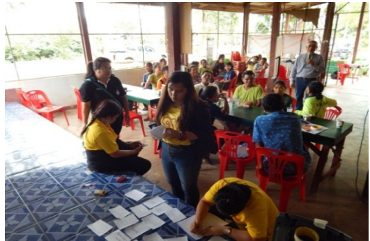
ภาพที่ 5 อบรมเชิงปฏิบัติการจัดทำแผนพัฒนาชุมชนแบบมีส่วนร่วม