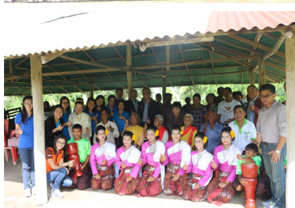
ภาพที่ 14 ผลสำเร็จของหมู่บ้านราชมงคลอีสาน ด้านวัฒนธรรม