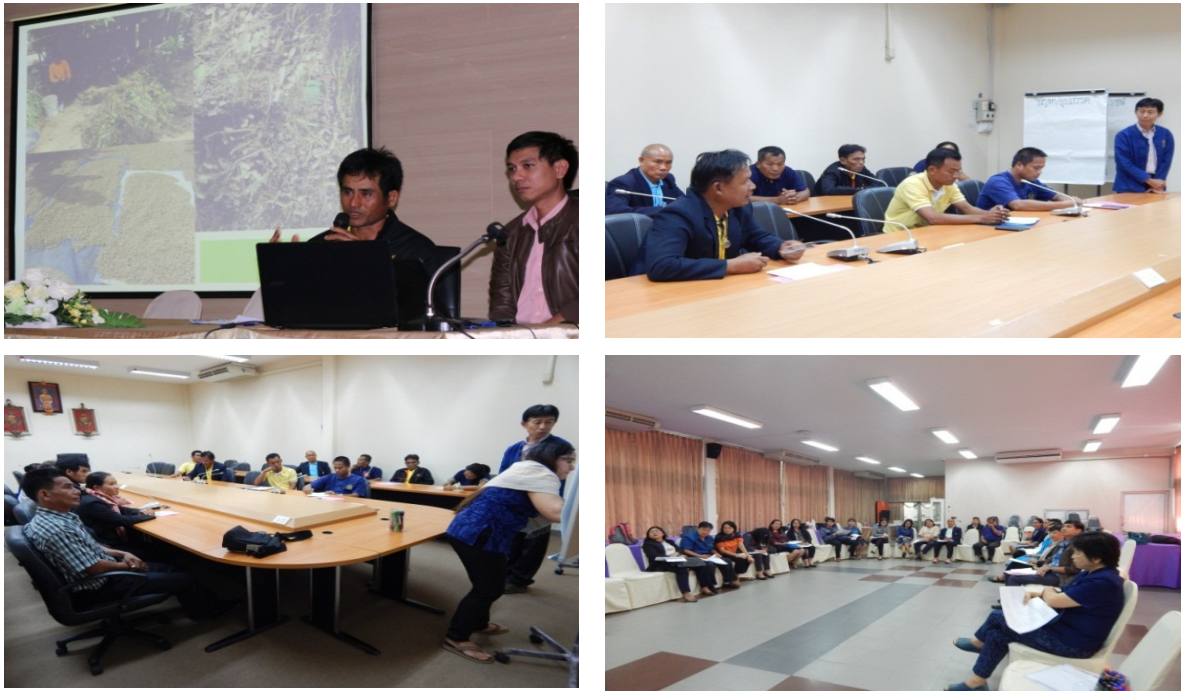
ภาพที่ 10 ผลการประเมินไปปรับปรุงและพัฒนากระบวนการดำเนินงานหมู่บ้านราชมงคลอีสาน