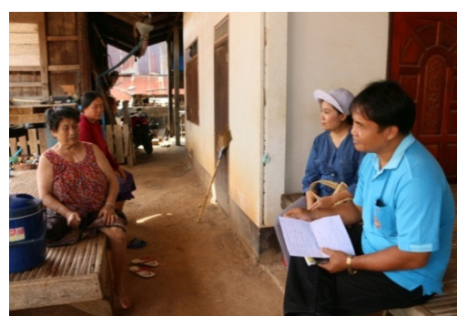
ภาพที่ 7 ลงพื้นที่สำรวจข้อมูลชุมชน (ศึกษาบริบทชุมชน)