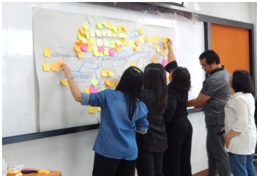
ภาพที่ 4 ฝึกอบรมเชิงปฏิบัติการการเป็นวิทยากรกระบวนการ (Facilitator)