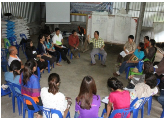
ภาพที่ 6 ฝึกอบรมเชิงปฏิบัติการถอดบทเรียนหมู่บ้านราชมงคลอีสาน