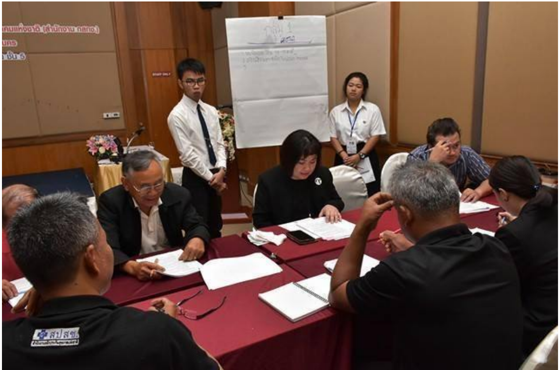
ภาพที่ 3: การจัดประชุมเชิงปฏิบัติการเพื่อรับฟังความคิดเห็นและข้อเสนอแนะ ภาคตะวันออกเฉียงเหนือ