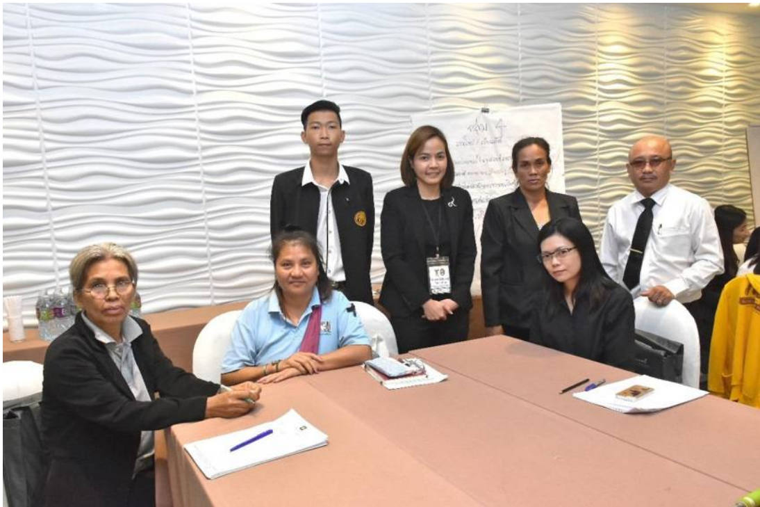
ภาพที่ 2: การจัดประชุมเชิงปฏิบัติการเพื่อรับฟังความคิดเห็นและข้อเสนอแนะ ภาคตะวันออกเฉียง

3. คณะผู้วิจัยสังเคราะห์ความคิดเห็นและข้อเสนอแนะ จากนั้นดำเนินการจัดทำแนวทางการกำกับดูแลตัวเองเพื่อเป็นมาตรฐานจริยธรรมขั้นพื้นฐานในรายการเกมโชว์และเรียลลิตี้โชว์