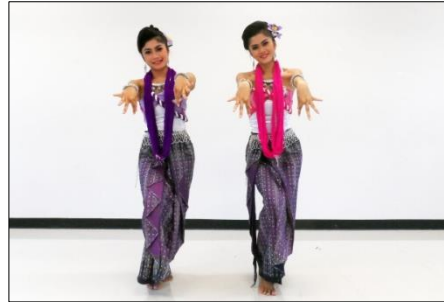
ภาพที่ 8 ท่าตำหูกนักแสดงยืนตรงเขย่งเท้าย่อ ตามจังหวะ มือทั้งกรรมวิธีของการตำหูก หรือ การทอผ้าลายขิด สองจีบยื่นมาข้างหน้า จีบ คว่ำหักข้อศอก เล็กน้อยศีรษะเอียงซ้าย