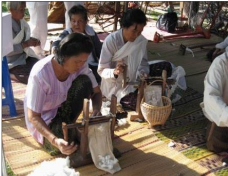
ภาพที่ 3 การอ้วฝ้าย การอ้วฝ้ายของชาวบ้านเพื่อที่จะนำ เอามาซิดทำให้เป็นเส้นฝ้าย