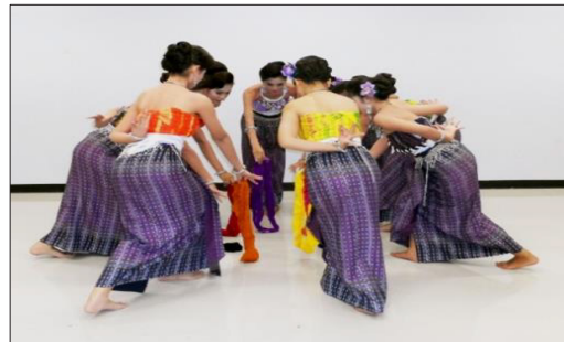
ภาพที่ 6 ท่าย้อมสีฝ้าย ผู้แสดง จะนำเอาฝ้ายลงไปย้อม ในหม้อ จับหัก ข้อศอกแนบหลังเท้าขวาก้าวไป ข้างหน้าทิ้ง น้ำหนักเท้าซ้ายวางหลังย่อเล็กน้อย