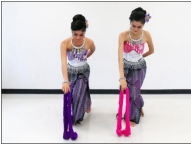
ภาพที่ 12 ทำย้อมผ้าฝ้าย