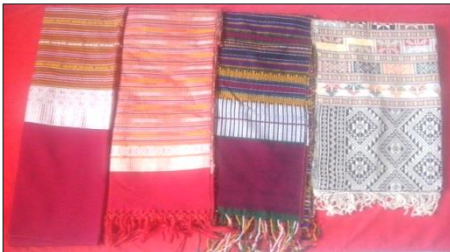
ภาพที่ 10 ตัวอย่างผ้าสไบลายซิด

ผ้าลายผ้าซิด ทั้งหมด 8 สี ได้แก่ สีแดง สีเขียว สีเหลือง สีดำ สีม่วง สีชมพู สีเขียว และ สีส้ม และผ้าสไบลายซิดที่มีลวดลายสวยงามอีกจำนวน 21 ลาย นำมาประกอบการแสดง โดยการถือไขว้และสอดสลับของผ้า สื่อให้เห็นประโยชน์ของการใช้ผ้าสไบลายซิด