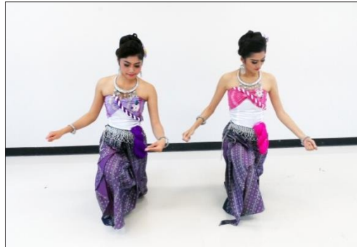
ภาพที่ 4 ลักษณะการฟ้อน เลียนแบบการอ้วฝ้ายผู้แสดงนั่งลง ตั้งเข่าขวา เข่าซ้ายวางหลัง ลำตัวตรง มือซ้ายป้อนฝ้ายมือขวา ปั่นฝ้าย ไป ตามจังหวะคีรีพระเอียงซ้าย