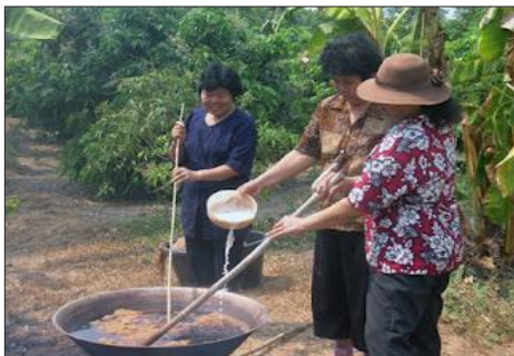
ภาพที่ 5 การย้อมสีฝ้าย ที่มา : บ้านหนองแวง อำเภोजตุรพักตร พิमान จังหวัดร้อยเอ็ด