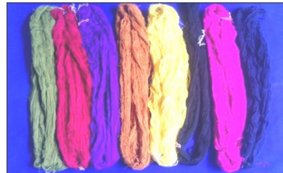
ภาพที่ 11 ฝ้ายสี ที่มา : บ้านหนองแวง ตำบลหนองผือ อำเภอจตุรพักตรพิมาน จังหวัดร้อยเอ็ด