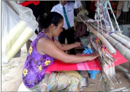
ภาพที่ 7 การตำหูกหรือการทอผ้าลายขิด