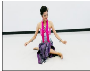
ภาพที่ 13 ทำปั่นผ้าฝ้าย