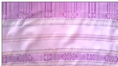
ภาพที่ 1 ชิตลายเลข 3 อารบิก

ผ้าสไบลายชิตที่ได้รับความนิยมมากที่สุด ได้แก่ลายเลข 3 อารบิกและลายหวานน้อย และลายที่ได้จากธรรมชาติ เช่น ลายรูปนก รูปนาคร ลายช้างลายพันธุ์พฤษภา ลายสิ่งของ ลายสิ่งก่อสร้างที่เป็นสิ่งแวดล้อมตามที่ได้พบเห็นมาทำการทอ ซึ่งต้องใช้ความชำนาญ และมีเชิงชั้นด้านฝีมือสูงกว่าการทอผ้าอย่างอื่นเพราะทำยาก ขั้นตอนการทอ ใช้อุปกรณ์การทอผ้าของอีสาน เริ่มจากการทำเส้นด้าย ใส่หลอดปั่นด้ายสอดใส่กระสวย ใช้กึ่งในการทอขณะทอที่ใช้แปรงหวีทุกคอยหวีเป็นช่วงๆเพื่อช่วยให้ด้ายเรียงเส้น และขั้นตอนที่สำคัญคือการเก็บชิต ซึ่งต้องใช้ไม้เก็บชิตเป็นอุปกรณ์สำคัญทำด้วยไม้ไผ่เหลาเล็ก ๆ กลมยาวซึ่งมีขนาดความกว้างของผ้าทอประมาณ 2 ศอก ใช้ประมาณ 20-30 อัน ไม้เก็บชิตจะเป็นสิ่งบังคับให้เกิดลวดลายต่าง ๆ บนเนื้อผ้าขณะที่ทอจะต้องเหยียบทุกสลับกับใช้ไม้เก็บชิตให้เกิดลวดลายตามต้องการ ความกว้าง ความยาวของผ้าขึ้นอยู่กับความต้องการของผู้บริโภค โดยมีไม้กำพันหรือไม้ม้วนผ้าคอยม้วนเก็บในช่วงการทอแต่ละครั้ง