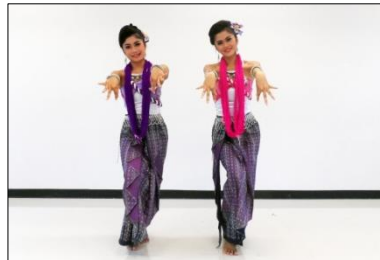
ภาพที่ 14 ทำการทอผ้าลายขีด