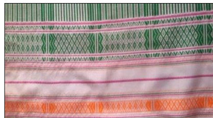
ภาพที่ 2 ลายหวานน้อย