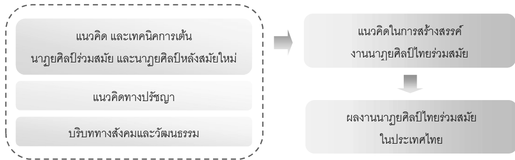
ภาพที่ 2 ที่มาของแนวคิดที่ปรากฏในการแสดงนาฏยศิลป์ไทยร่วมสมัยในประเทศไทย ระหว่าง ปี พ.ศ.2530 -2560

จากภาพที่ 2 ที่มาของแนวคิดที่ปรากฏในการแสดงนาฏยศิลป์ไทยร่วมสมัยในประเทศไทย ระหว่าง ปี พ.ศ.2530 -2560 แสดงให้เห็นถึงปัจจัยที่มีอิทธิพลต่อแนวคิดในการสร้างสรรค์งานนาฏยศิลป์ไทยร่วมสมัยในประเทศไทย แบ่งออกได้ 3 ปัจจัยคือ