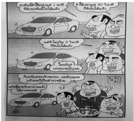
ภาพที่ 1.3 มหาสนุก, 27 (1251), 47

การ์ตูนตลกสายลับตาหมีได้กำหนดให้ตัวละครเจ้าหน้าที่รัฐมีท่าทางในเชิงบวก เห็นได้จากภาพที่ 1.1 และภาพที่ 1.2 เป็นภาพที่ตำรวจยกมือขึ้นแตะหมวก สื่อให้เห็นการปฏิบัติหน้าที่ นอกจากนี้ยังมีภาพที่แสดงให้เห็นว่าตำรวจมีความสามารถ ดังนี้