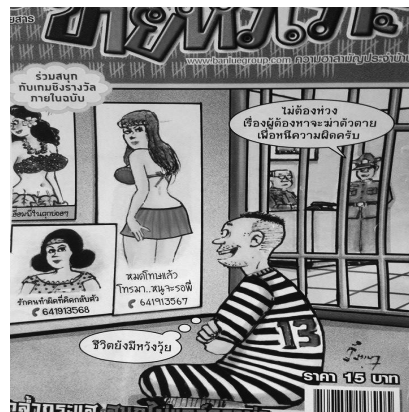
ภาพที่ 1.4 ชายหัวเราะ, 30 (1331), ปก

จากภาพที่ 1.3 จะเห็นว่าในกรอบสุดท้ายตำรวจอยู่ตรงกลางระหว่างคนร้าย ตัวของตำรวจใหญ่กว่าคนร้าย และท่าทางใส่กุญแจมือคนร้าย ส่วนคนร้ายมีเหงื่อผุดและมีสีหน้าตกใจ ภาพที่ 1.4 ส่วนที่เด่นที่สุดคือ นักโทษกำลังดูภาพสาวสวยจนทำให้เกิดกำลังใจไม่ฆ่าตัวตาย ซึ่งเป็นแผนการของตำรวจ การทำให้ภาพส่วนนี้เด่นที่สุดจึงเป็นเน้นย้ำให้เห็นความสามารถของตำรวจ