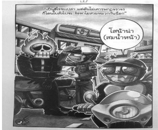
ภาพที่ 1.2 มหาสนุก, 27 (1260), 7

ภาพที่ 1.1 จำเลยในการ์ตูนถูกสื่อว่าเป็นหุ่นจำลองที่มีความสามารถจับผู้ร้ายได้ซึ่งตรงข้ามกับกระแสวิพากษ์วิจารณ์ในสังคมที่เห็นว่าจำเลยไม่มีประโยชน์ในการปราบปรามอาชญากรรม แต่ด้วยทการ์ตูนกลับสอดคล้องกับนโยบาย “จำเลย ไม่เคยอีกแล้ว” ของกองบัญชาการตำรวจแห่งชาติ ซึ่งเป็นนโยบายเพื่อให้สังคมตำรวจรับรู้ว่าประชาชนต้องการจำไม่เลย คือ ต้องการให้จำเลยดูแลสังคม โดยเฉพาะการให้บริการและให้วิธีป้องกันอาชญากรรม (ทีมข่าวอาชญากรรม, 2556) กล่าวได้ว่าจำเลยในตวับทการ์ตูนและจำเลยตามความหมายของกองบัญชาการตำรวจแห่งชาติผลิตสร้างความหมายแบบเดียวกันเพื่อต่อต้านกระแสวิพากษ์วิจารณ์จำเลยในสังคม