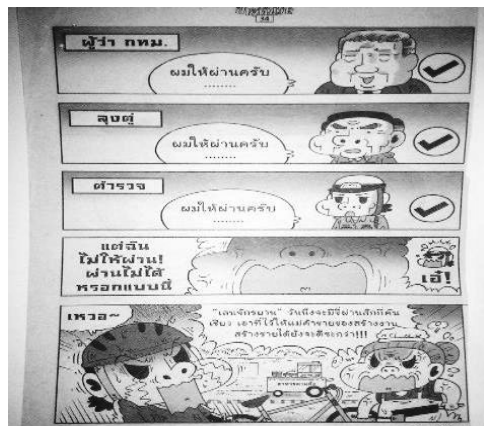
ภาพที่ 2.4 ชายหัวเราะ, 30 (1331), 34