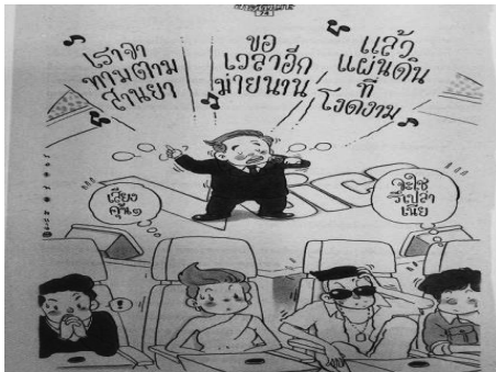
ภาพที่ 3.1 ชายหัวเราะ, 30 (1335), 74

การ์ตูนตลกทรายส์ปาด้าได้เชื่อมโยงสิ่งที่สังคมรับรู้กันอยู่แล้ว คือรายการ เดอะวอยซ์ กับผู้นำรัฐบาลทหาร และมีการเชื่อมโยงตัวละครอะพोकคาลิปส์ในภาพยนตร์เรื่อง เอ็กซ์เมน อะพोकคาลิปส์ เข้ากับบริบททางการเมือง