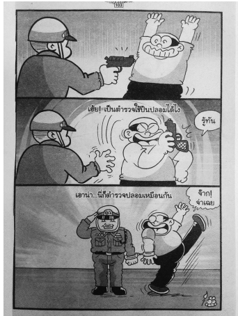
ภาพที่ 1.1 ชายหัวเราะ, 30 (1341), 103