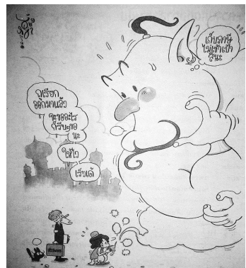
ภาพที่ 2.1 ชายหัวเราะ, 31 (1410), 14