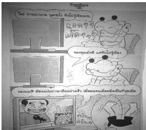
ภาพที่ 2.3 ชายหัวเราะ, 31 (1392), 68

นอกจากนี้ยังมีภาพที่สื่อถึงลักษณะไม่พึงประสงค์ของเจ้าหน้าที่รัฐหรือนโยบายรัฐ โดยแสดงให้เห็นว่าประชาชนแสดงความไม่พอใจ ดังภาพ