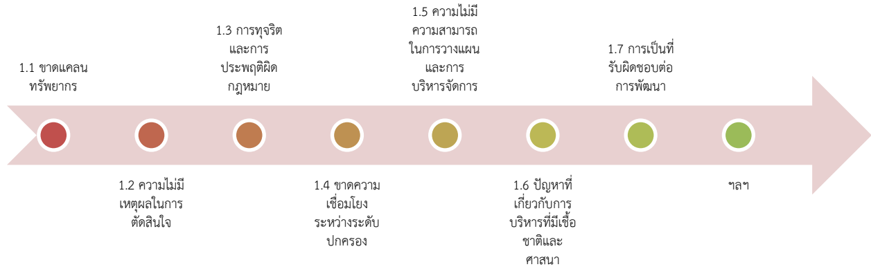
ภาพที่ 1 ปัญหาการบริหารงานภาครัฐบาลท้องถิ่น

ดังนั้นเพื่อแก้ไขปัญหาการบริหารงานภาครัฐบาลท้องถิ่น จำเป็นต้องมีการพัฒนาความรู้และทักษะในการบริหารจัดการที่เหมาะสม การสร้างกระบวนการตัดสินใจที่โปร่งใสและมีส่วนร่วม การส่งเสริมความโปร่งใสและความเชื่อถือ และการเสริมสร้างความสามารถในการวางแผนและการบริหารจัดการที่มีการใช้ทรัพยากรในท้องถิ่นอย่างเหมาะสม