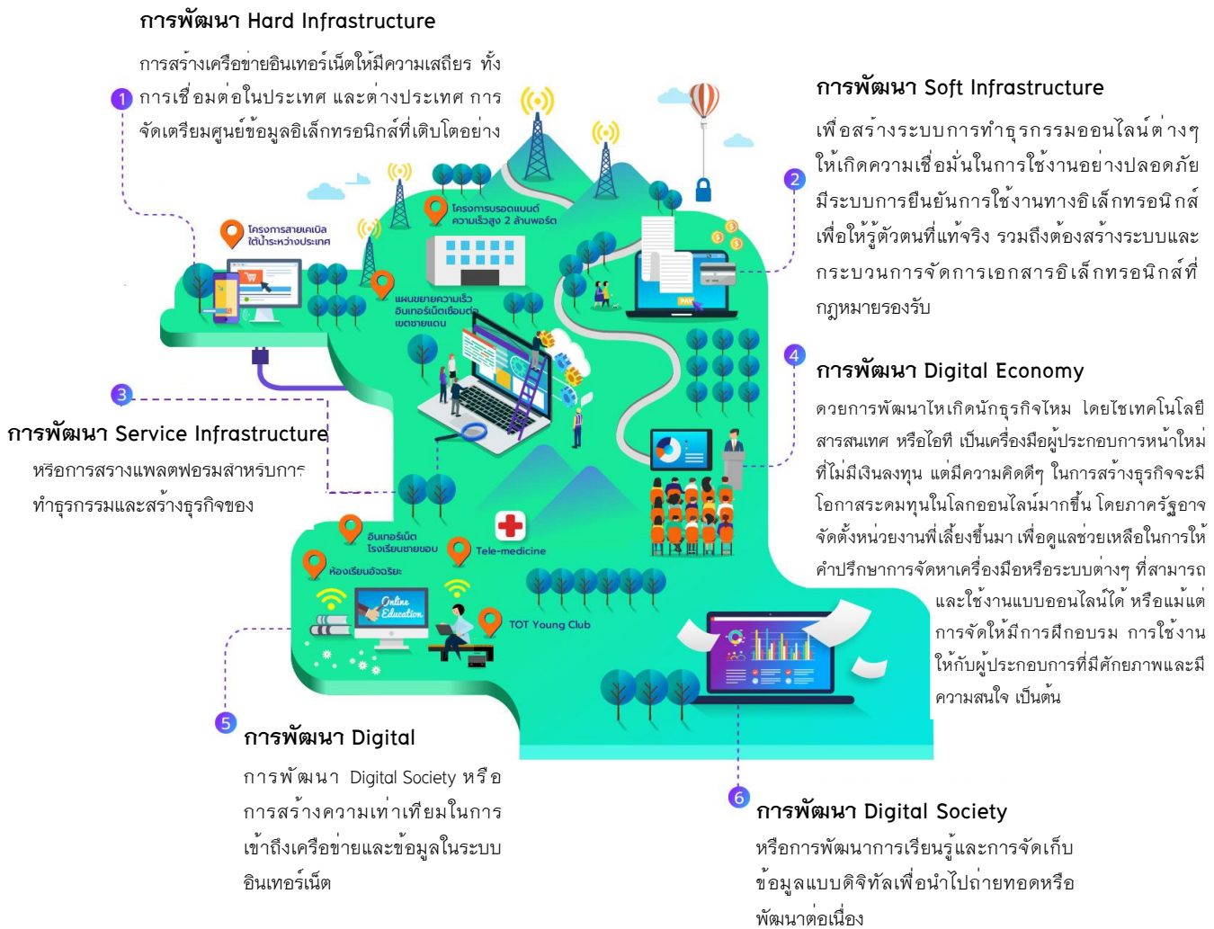
ภาพที่ 3 โมเดลรูปแบบการยอมรับการบริหารองค์การของบริษัท ทีไอที จำกัด (มหาชน) เพื่อรองรับการขยายตัวของเศรษฐกิจดิจิทัล