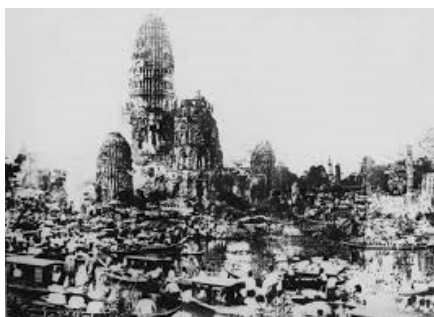
ภาพที่ 4 พระมหาธาตุวัดมหาธาตุของเมืองพระนครศรีอยุธยา

สำหรับพระมหาธาตุวัดมหาธาตุ ซึ่งในปัจจุบันรู้จักกันในนาม “วัดมหาธาตุอยุธยา” เป็นพระมหาธาตุขนาดใหญ่ซึ่งเป็นศาสนสถานประจำเมืองพระนครศรีอยุธยา พระมหาธาตุนี้เป็นอนุเสาวรีย์ซึ่งก่อสร้างขึ้นเพื่อเป็นที่ประดิษฐานพระบรมสารีริกธาตุ มีนัยยะสำคัญคือ เครื่องยึดเหนี่ยวจิตใจและเครื่องเตือนให้พุทธบริษัทได้ระลึกถึงพระพุทธเจ้าหลังเสด็จดับขันธปรินิพพานไปแล้ว พระมหาธาตุวัดมหาธาตุมิได้เป็นเพียงพระมหาธาตุประจำเมืองเท่านั้นแต่ยังเป็น “มหาธาตุแห่งราชอาณาจักรอยุธยา” ซึ่งทำหน้าที่เชิงความหมายที่สัมพันธ์กับราชอาณาจักรในเรื่องสิ่งยืนยันความสำคัญของเมืองพระนครศรีอยุธยาในฐานะเมืองหลวงของราชอาณาจักร