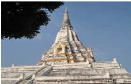
ภาพที่ 3 พระมหาเจดีย์วัดภูเขาทอง

สำหรับพระมหาธาตุวัดมหาธาตุ ซึ่งในปัจจุบันรู้จักกันในนาม “วัดมหาธาตุอยุธยา” เป็นพระมหาธาตุขนาดใหญ่ซึ่งเป็นศาสนสถานประจำเมืองพระนครศรีอยุธยา พระมหาธาตุนี้เป็นอนุเสาวรีย์ซึ่งก่อสร้างขึ้นเพื่อเป็นที่ประดิษฐานพระบรมสารีริกธาตุ มีนัยยะสำคัญคือ เครื่องยึดเหนี่ยวจิตใจและเครื่องเตือนให้พุทธบริษัทได้ระลึกถึงพระพุทธเจ้าหลังเสด็จดับขันธปรินิพพานไปแล้ว พระมหาธาตุวัดมหาธาตุมิได้เป็นเพียงพระมหาธาตุประจำเมืองเท่านั้นแต่ยังเป็น “มหาธาตุแห่งราชอาณาจักรอยุธยา” ซึ่งทำหน้าที่เชิงความหมายที่สัมพันธ์กับราชอาณาจักรในเรื่องสิ่งยืนยันความสำคัญของเมืองพระนครศรีอยุธยาในฐานะเมืองหลวงของราชอาณาจักร