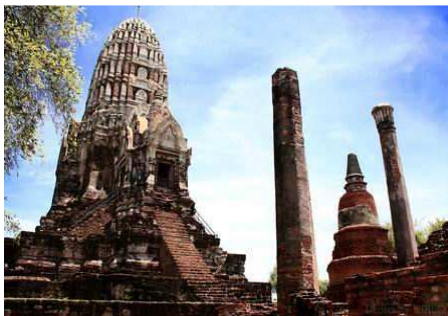
ภาพที่ 2 พระมหาธาตุวัดราชบูรณะ