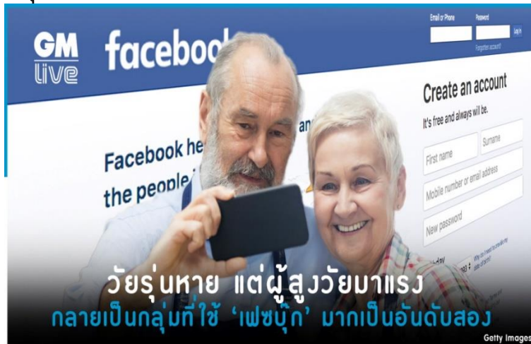
ภาพที่ 2 การใช้เฟซบุ๊กของผู้สูงอายุ