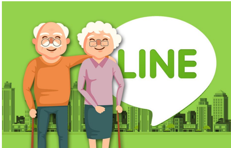
ภาพที่ 1 การใช้ไลน์ของผู้สูงอายุ