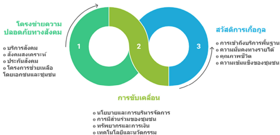
ภาพที่ 1 กรอบแนวคิดในการวิจัย

การขับเคลื่อนโครงข่ายความปลอดภัยทางสังคมสู่สวัสดิการเกื้อกูลในพื้นที่จังหวัดปัตตานี นั้นเป็นการเชื่อมโยงงานของ โครงข่ายความปลอดภัยทางสังคม ได้แก่ บริการสังคม สังคมสงเคราะห์ ประกันสังคม และ โครงการช่วยเหลือโดยเอกชนและชุมชน ผ่านการขับเคลื่อนงานซึ่งเป็นสิ่งที่จะศึกษาในครั้งนี้ ได้แก่ นโยบายและการบริหารจัดการ การมีส่วนร่วมของชุมชน ทรัพยากรและการเงิน และ เทคโนโลยีและนวัตกรรม ไปสู่การมีสวัสดิการเกื้อกูล ที่จะทำให้ประชาชน การเข้าถึงบริการพื้นฐาน มีความมั่นคงทางรายได้ มีคุณภาพชีวิต และ มีความเข้มแข็งของชุมชน ซึ่งจะช่วยให้เข้าใจถึงความสัมพันธ์ระหว่างปัจจัยต่างๆ ที่ส่งผลต่อความเป็นอยู่ที่ดีของประชาชนและชุมชน