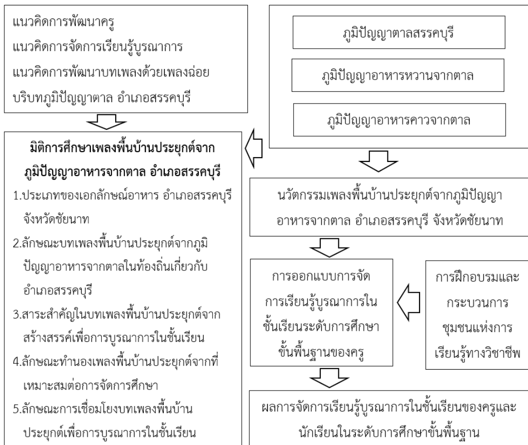
แผนภาพที่ 1 แสดงกรอบแนวคิดในการวิจัย