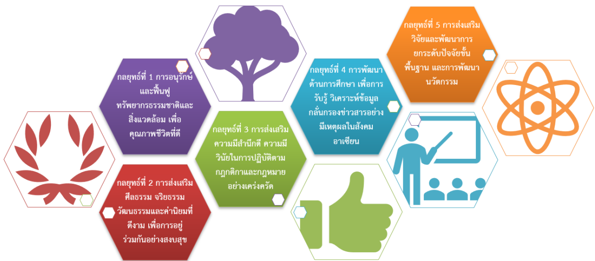
แผนภาพที่ 3 แสดงองค์ความรู้ใหม่

จากการศึกษาแผนกลยุทธ์การดำเนินงานตามโครงการคนดีศรีสุพรรณ จังหวัดสุพรรณบุรี พบองค์ความรู้ที่สามารถสรุปเป็นแผนภาพได้ดังนี้