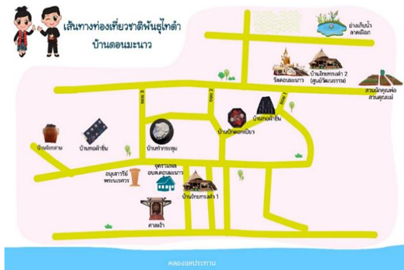
ภาพที่ 1 แสดงเส้นทางการท่องเที่ยวเชิงสร้างสรรค์บนรากฐานภูมิปัญญาทางวัฒนธรรมของไทดำ

กิจกรรมและเส้นทางการท่องเที่ยวที่เข้าร่วมกับชุมชนได้ดังนี้ คือ เส้นทาง “เยือนถิ่นแห่งศรัทธา วัฒนธรรมแห่งความเชื่อและจิตวิญญาณ ไทดำ” ได้ 2 รูปแบบ คือ แบบวันเดียว และแบบ 2 วัน 1 คืน