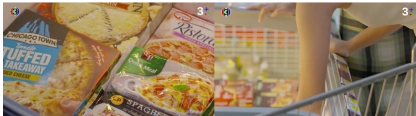
ภาพที่ 4 ดาวเลือกซื้ออาหารแช่แข็ง

จากภาพและบทสนทนาข้างต้นแสดงให้เห็นว่า กษิตติมีความคาดหวังว่าผู้หญิงที่ดีและสมบูรณ์แบบอย่าง “ดาว” จะต้องสามารถทำอาหารได้ดี สะท้อนให้เห็นถึงความคาดหวังของสังคมที่มีต่อผู้หญิงในเรื่องของการประกอบอาหารและแม้ว่าดาวไม่ถนัดทำอาหารฝรั่ง แต่ก็ไม่ได้ปฏิเสธ เพราะอยากรักษาความเป็นผู้หญิงที่สมบูรณ์แบบของตนเองไว้ โดยแก้ปัญหาด้วยการหาซื้ออาหารแช่แข็งมาจัดจานให้รับประทานแทนตามคำแนะนำของแม่ เพื่อนสนิทของเธอ ดังในละครเรื่องเมียอาชีพ ตอนที่ 5 ดังนี้