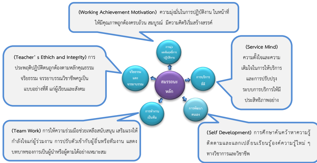
แผนภาพที่ 1 แสดงสมรรถนะหลัก (Core Competency) 5 สมรรถนะ