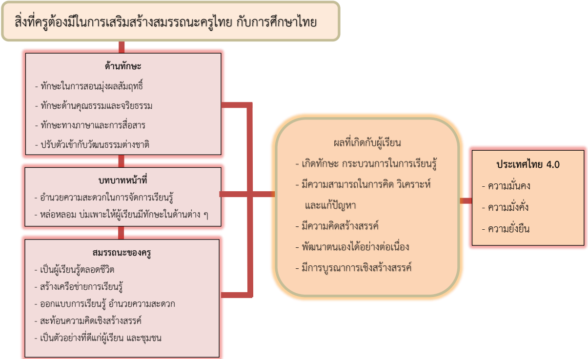
แผนภาพที่ 4 แสดงสิ่งที่ครูต้องมีการเสริมสร้างสมรรถนะครูไทย กับการศึกษาไทย 4.0

จากการศึกษาการเสริมสร้างสมรรถนะครูไทย กับการศึกษาไทย 4.0 ครูที่จะทำให้เกิดระบบการศึกษาไทย 4.0 นั้นครูจะต้องมีทักษะ ในด้านการสอนเพื่อมุ่งผลสัมฤทธิ์ทักษะด้านคุณธรรมจริยธรรม ทักษะด้านภาษาการสื่อสาร และการปรับตัวเข้ากับวัฒนธรรมต่างชาติ การจัดการเรียนรู้ยุคใหม่ ครูจะต้องมีบทบาทที่สำคัญ ได้แก่ เป็นผู้อำนวยความสะดวกในการเรียนรู้ทำหน้าที่บ่มเพาะ หล่อหลอม ให้ผู้เรียนเกิด “ทักษะ” ด้านต่าง ๆ และมีการพัฒนาอย่างต่อเนื่องมีสมรรถนะในการเป็นผู้มุ่งมั่น ใฝ่เรียนรู้อยู่ตลอดเวลา เป็นผู้ออกแบบการเรียนรู้ ผู้อำนวยความสะดวกในการจัดการเรียนรู้ สร้างเครือข่ายการเรียนรู้ สร้างความสัมพันธ์ระหว่าง โรงเรียน ครอบครัว ชุมชน และท้องถิ่น พร้อมทั้งจะ ก้าวทันความเปลี่ยนแปลงและก้าวทันโลกที่เปลี่ยนไป ตลอดจนส่งเสริมให้ผู้เรียนได้ใช้การคิดวิเคราะห์ การแก้ปัญหา และการคิดสร้างสรรค์ ซึ่งจะช่วยให้ผู้เรียนสามารถนำองค์ความรู้ที่มีอยู่มาบูรณาการเชิงสร้างสรรค์ เพื่อสร้างผลผลิตหรือนวัตกรรมต่าง ๆ อันเป็นฐานในการพัฒนาประเทศต่อไปในอนาคต ครูจำเป็นต้องนำผลสะท้อนจากผู้เรียนมาปรับเปลี่ยน เสริมสร้างสมรรถนะครูไทย ให้มีการเชื่อมโยงและ พัฒนาอย่างต่อเนื่องให้สอดคล้องกับสถานการณ์ที่อาจเปลี่ยนแปลงได้ตลอดเวลาในปัจจุบัน เพื่อนำไปสู่ การพัฒนาระบบการศึกษาไทยตามนโยบายประเทศไทย 4.0