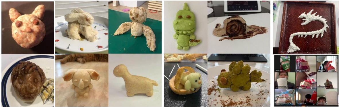
รูปที่ 5 ผลงานความคิดสร้างสรรค์ของนักเรียน หน่วยการเรียนรู้ที่ 2 คาบที่ 4