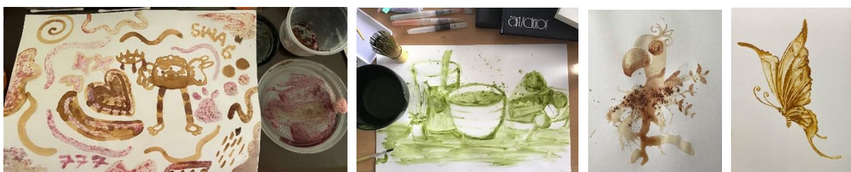
รูปที่ 4 ผลงานความคิดสร้างสรรค์ของนักเรียน หน่วยการเรียนรู้ที่ 2 คาบที่ 3