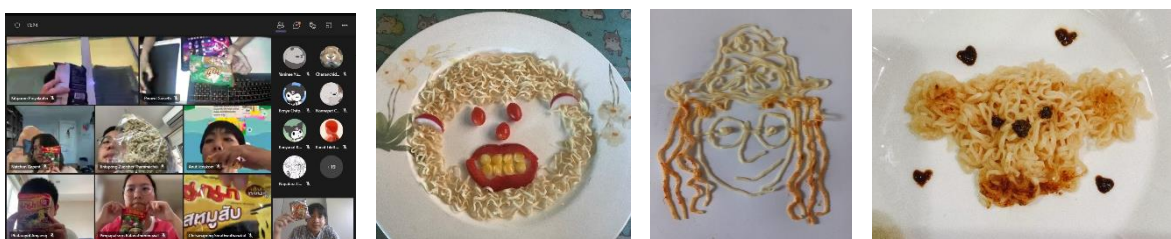
รูปที่ 3 ผลงานความคิดสร้างสรรค์ของนักเรียน หน่วยการเรียนรู้ที่ 1 คาบที่ 2