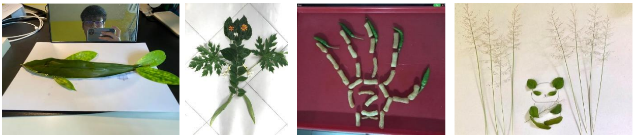
รูปที่ 2 ผลงานความคิดสร้างสรรค์ของนักเรียน หน่วยการเรียนรู้ที่ 1 คาบที่ 1

2.2 ควรมีการวิจัยเพื่อเปรียบเทียบความคิดสร้างสรรค์ของนักเรียนชั้นมัธยมศึกษาก่อนและหลังการใช้รูปแบบการจัดการเรียนรู้ศิลปะเป็นฐาน