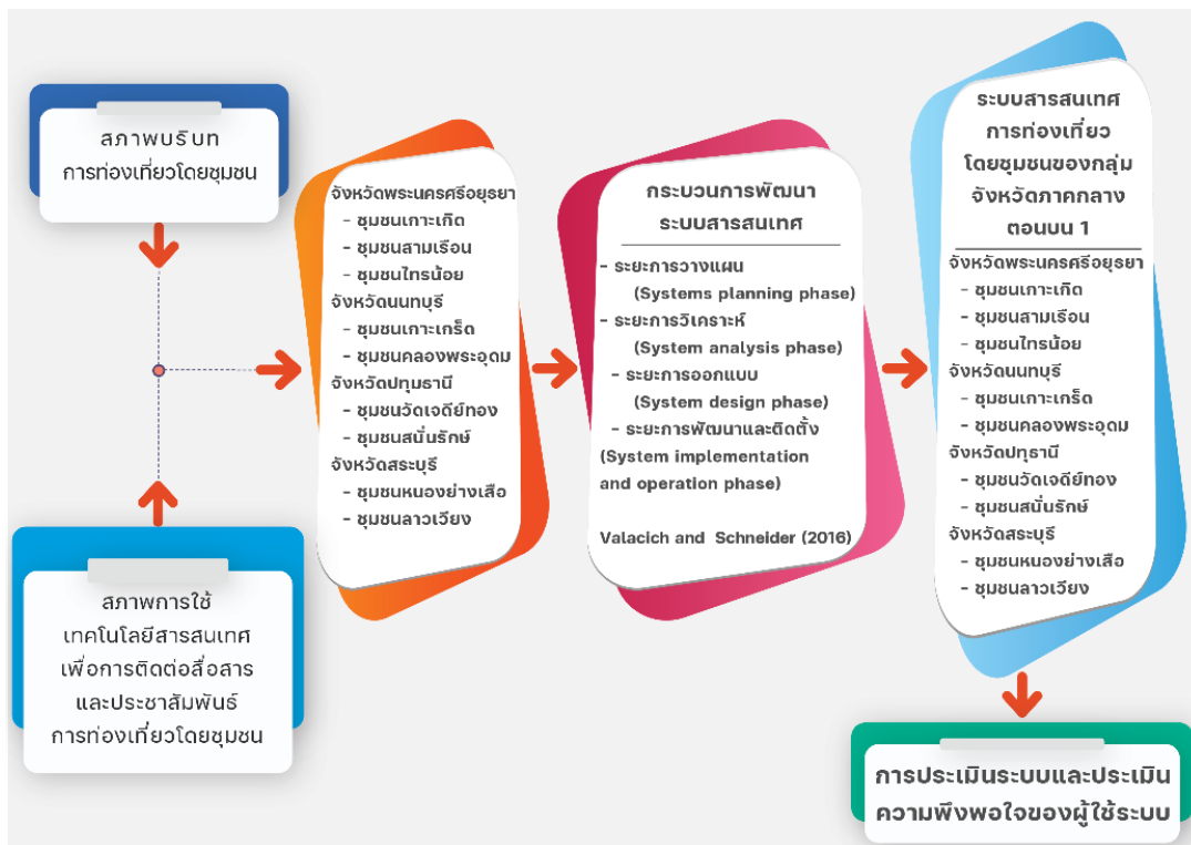
ภาพที่ 1 แสดงกรอบแนวคิดในการวิจัย

จากแนวคิดและงานวิจัยที่เกี่ยวข้องรวมทั้งวิธีการวิจัยนำไปสู่วงจรการพัฒนาแบบ SDLC (System Development Life Cycle) มาใช้พัฒนาระบบสารสนเทศเพื่อการท่องเที่ยวโดยชุมชนของกลุ่มจังหวัดภาคกลางตอนบน1 ซึ่งสามารถสร้างกรอบแนวคิดในการวิจัยได้ดังนี้