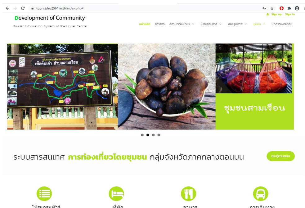
ภาพที่ 4 แสดงหน้าจอหลักสำหรับผู้ใช้งานระบบ

ผลการประเมิน ประกอบด้วย การประเมินระบบ และการประเมินความพึงพอใจของผู้ใช้ ดังนี้