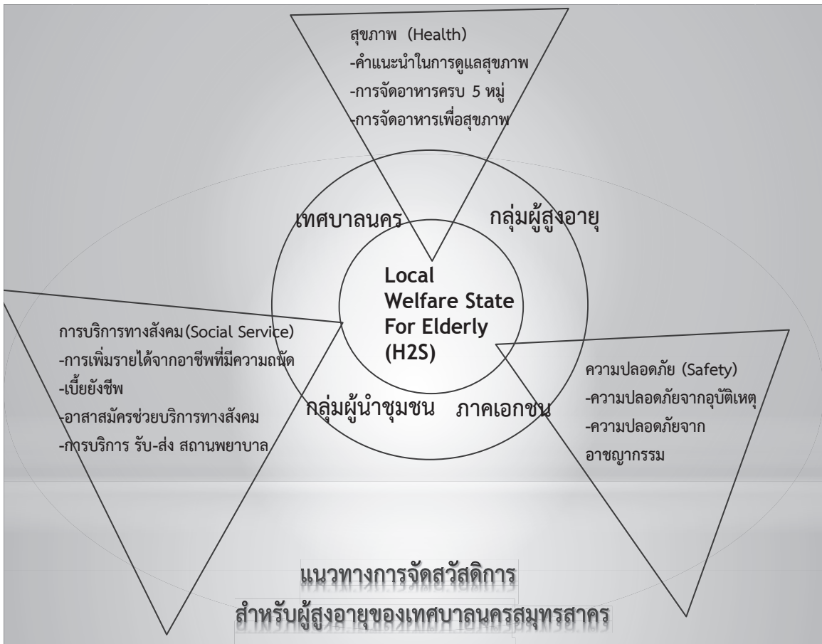
ภาพที่ 2 รูปแบบการจัดการสวัสดิการผู้สูงอายุของเทศบาลนครสมุทรสาครในเชิงอนาคต

ถึงความดำเนินงานและความโปร่งใสในการทำงาน เสนอข้อคิดเห็นหรือจัดตั้งโครงการต่าง ๆ ในชมรมหรือสวัสดิการที่จัดขึ้นตามนโยบายงบประมาณมายังภาครัฐเพื่อทราบถึงความดำเนินงานและความโปร่งใสในการทำงานเสนอข้อคิดเห็นร่วมกันจะได้มีการจัดทำสวัสดิการผู้สูงอายุได้ตรงจุดและมีประสิทธิภาพมากที่สุด