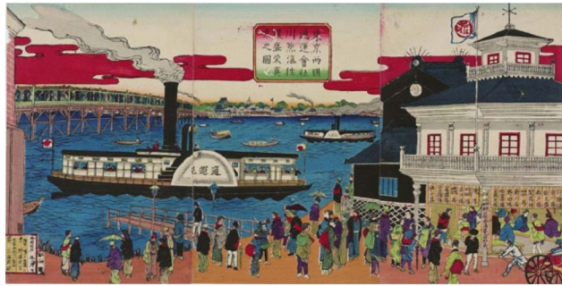
การฟื้นฟูเมจิ (Meiji Restoration)