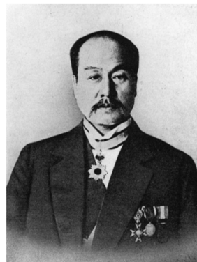
Luther Whiting Mason และ Isawa Shuji