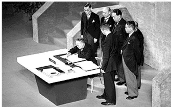
การลงนามในสนธิสัญญา “ Treaty of San Francisco”

หากจะสรุปพัฒนาการของการศึกษาด้านดนตรีในประเทศญี่ปุ่นอาจกล่าวได้ว่า จุดเริ่มต้นที่แท้จริงคือการดำเนินการโดยรัฐบาล ซึ่งในขณะนั้นต้องเผชิญกับสถานะจำยอมที่ต้องเปิดรับการเปลี่ยนแปลงทางด้านวัฒนธรรม โดยได้รับอิทธิพลมาจากการขยายตัวของการพัฒนาประเทศไปสู่ประเทศอุตสาหกรรม ลัทธิจักรวรรดินิยมและการเข้ามาของศาสนาคริสต์ ซึ่งเป็นการพัฒนาภายใต้การกำกับดูแลอย่างใกล้ชิดจากรัฐบาล ซึ่งผลคือรัฐบาลล้มเหลวที่จะผสานวัฒนธรรมดนตรีตะวันตกเข้ากับวัฒนธรรมดนตรีของญี่ปุ่น ยิ่งไปกว่านั้นดนตรีตะวันตกได้กลายเป็นแกนหลักในการเรียนดนตรีในโรงเรียนทั่วประเทศ ญี่ปุ่นอันเป็นผลมาจากการวางนโยบายที่อิงดนตรีตะวันตกในระดับสูงและในระดับการปฏิบัติมีบทเพลงเพียงไม่กี่บทเพลงที่เป็นบทเพลงพื้นบ้านดั้งเดิมของญี่ปุ่นที่ถูกนำมาบรรจุไว้ในหนังสือแบบเรียน ยิ่งไปกว่านั้นในภาพกว้างรัฐบาลญี่ปุ่นยังใส่ใจเพียงแต่การใช้ดนตรีเพื่อเป็นเครื่องมือในการขัดเกลาผู้เรียนโดยใช้นักร้องตะวันตกเป็นหลัก แต่ไม่ได้คำนึงถึงรายละเอียดส่วนลึกที่ส่งผลให้ดนตรีพื้นบ้านของญี่ปุ่นมีบทบาทลดน้อยลงไปอย่างมากจนถึงยุคหลังสงครามโลกครั้งที่ 2 เลยทีเดียว