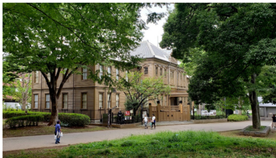
วิทยาลัยการดนตรีแห่งโตเกียว “Tokyo ongaku gakku”

วัตถุประสงค์ข้อที่ 2 คือการให้การศึกษาด้านดนตรีแก่บุคคลชั้นนำในญี่ปุ่น ซึ่งส่วนใหญ่ล้วนเป็นนักดนตรีที่บรรเลงอยู่ในวงดนตรีราชสำนักของญี่ปุ่น ประกอบกับส่วนใหญ่อีกเป็นบุตรหลานของขุนนางของญี่ปุ่นแทบทั้งสิ้น โดยทั้งหมดได้รับการสอนวิชาดนตรีโดยเข้าศึกษาในระบบการเรียนหลักสูตร 4 ปี โดยเรียนเปียโน โกโต โกเคียว ไวโอลิน การประสานเสียง ทฤษฎีดนตรีตะวันตก ประวัติศาสตร์ดนตรีตะวันตกและหลักการสอนดนตรี โดยวัตถุประสงค์ข้อนี้บรรลุผลเป็นอย่างมาก เนื่องจากมีนักเรียนถึง 3 คนที่สำเร็จการศึกษานี้แล้วกลับมาทำหน้าที่เป็นอาจารย์ผู้สอนใน “Tokyo ongaku gakko” หรือวิทยาลัยการดนตรีแห่งโตเกียวในปัจจุบันที่ซึ่งพัฒนาต่ออย่างมากจากสถาบันการศึกษาด้านดนตรี Ongaku torishirabe katari” นั้นเอง สืบเนื่องจากวัตถุประสงค์ข้อที่ 2 เหล่าบัณฑิตที่จบการศึกษาจากสถาบันยังได้เข้าไปทำงานเป็นอาจารย์และครูในโรงเรียนทั่วทั้งประเทศญี่ปุ่นพร้อมทั้งนำหนังสือแบบเรียนและแนวการสอนที่พัฒนามาจากสถาบันไปใช้ จนเป็นรากฐานที่สำคัญของการวางระบบการศึกษาดนตรีในโรงเรียนของญี่ปุ่นทั้งนั้นและเป็นการบรรลุวัตถุประสงค์ของการก่อตั้งสถาบันการศึกษาด้านดนตรีข้อที่ 3 ด้วยเช่นกัน