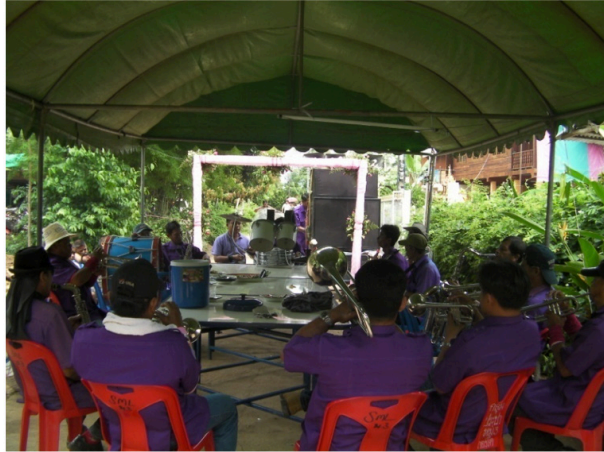
ภาพที่ 2 แตรวงคณะบ้านตาลในงานอุปสมบท

1.2 การเดินบรรเลงเพื่อนำขบวนแห่หน้าขบวนนั้น แตรวงพื้นบ้านงานบวชคณะบ้านตาล จังหวัดอุดรดิตถ์ ไม่มีการจัดเรียงรูปขบวนที่แน่นอน แต่นิยมให้กลองทรีไอ้(กลองไซโล) กลองใหญ่และฉาบอยู่แถวหน้า จึงตามด้วยทรมเป็ต แซกโซโฟน ทรอมโบน