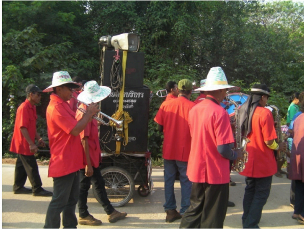
ภาพที่ 4 แตรวงคณะบ้านตาลในงานอุปสมบท