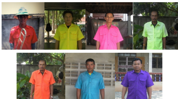
ภาพที่ 4 แต่งกายเล่นงานวันอาทิตย์ - วันเสาร์

แตรวงคณะบ้านตาลแต่งกายโดยสีเสื้อที่สวมใส่จะเปลี่ยนไปตามตามสีประจำวัน สวมกางเกงทรงสแล็ค รองเท้าคัทชู และใส่หมวกขวานาसानด้วยไม้ไผ่ ซึ่งหมวกจะใส่เฉพาะในช่วงที่บรรเลงเท่านั้นในการเคลื่อนขบวนเริ่มออกจากบ้านแบ่งเป็นช่วงเช้าและช่วงบ่ายขึ้นอยู่กับทางเจ้าภาพจะหากฤกษ์ยามใดเหมาะสมกับความพร้อมของตัวเอง โดยสาเหตุที่ต้องแต่งกายตามสีประจำวันนั้น เกิดการเปลี่ยนแปลงจากหัวหน้าวงรุ่นที่ 3 เห็นว่าแตรวงคณะของเราควรปรับตัวการแต่งกายให้เหมาะสมกับสถานการณ์ต่างๆ เลยมีการตั้งข้อตกลงกันให้แต่งการตามสีประจำวันของแต่ละวันไม่ว่าจะเป็นงานบวชหรืองานศพ